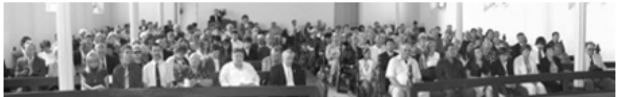
Húsvéti gyülekezet a Nth. Fitzroy-i Magyar Református Templomban

2008 Húsvétjában azzal a reménységgel tárjuk ki templomunk kapuját és terítjük meg az Úr asztalát, hogy sok mai Tamás fog lélekben találkozni a feltámadott Jézussal. Úgy legyen!