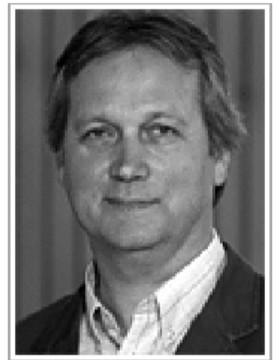
Dr. Freund Tamás akadémikus, orvosprofesszor

A politikai helyzet elemzése – hogy mindenki tisztán lásjon – a 2008. február 18-i Gyurcsány értékelés ellenpontjaként.