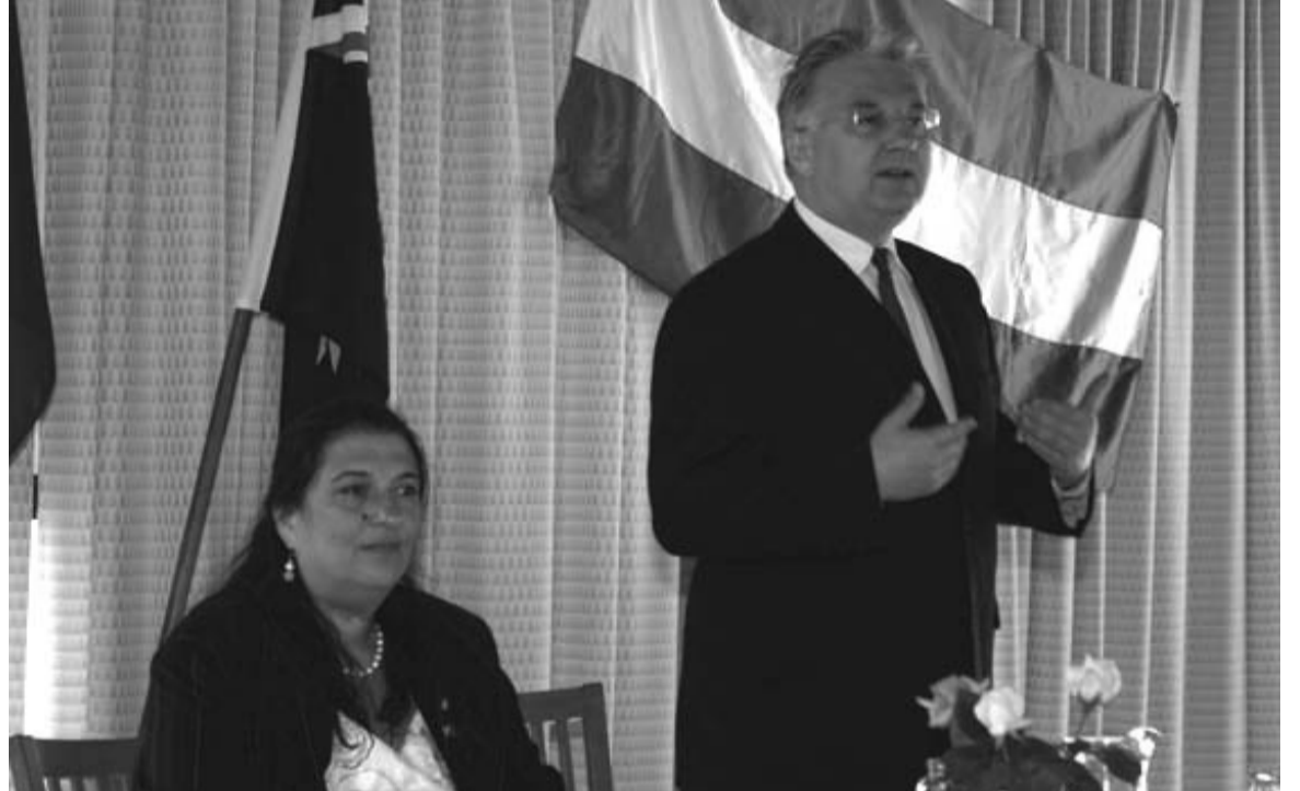
Sikó Anna nagykövet, dr. Semjén Zsolt. Tanácskozás Canberrában a magyar társadalmi vezetőkkel.

Vendégünk szívünkbe fogalmazta meg, és elmondta nálunk is: „Minden nemzet egyszeri és megismételhetetlen érték. Egy sajátos arc, Istennek egy gondolata. Senki nem adhatja azt az értéket, ami a magyarság, csak mi magyarok. Nekünk, magyaroknak, az egyetemes emberiség iránti kötelességünk saját magyarságunk megőrzése, kimunkálása és felmutatása. Mert