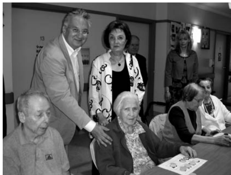
A Szent Erzsébet Otthonban