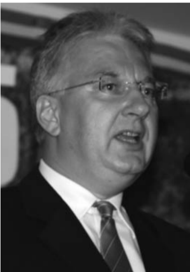
Dr. Semjén Zsolt