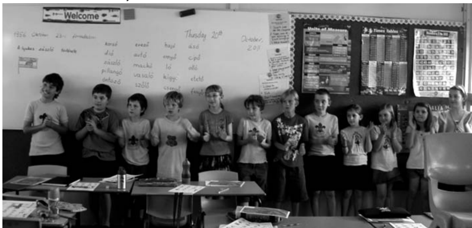
A Cserkész Otthonban