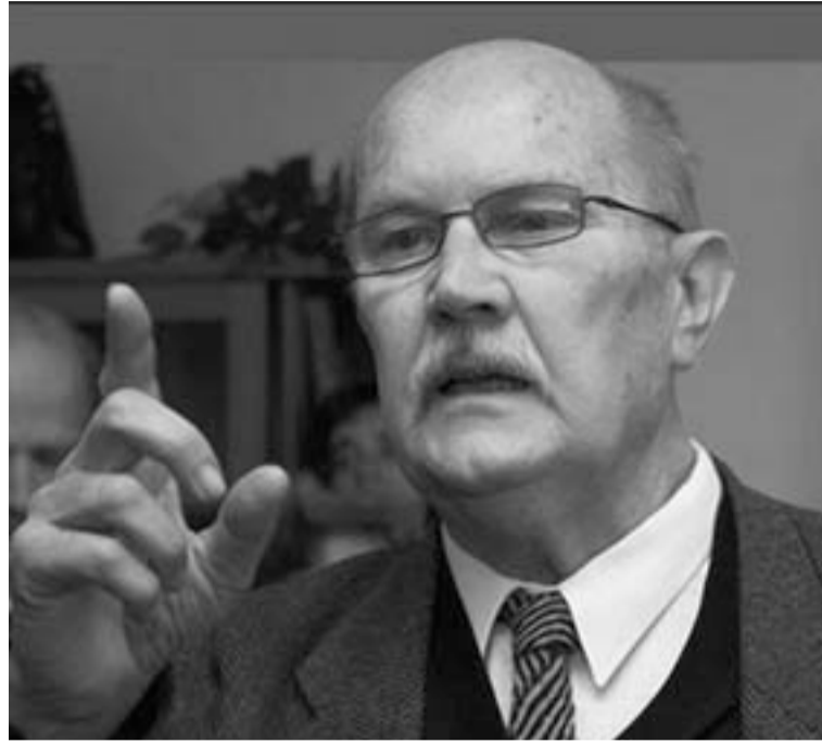
MAKOVECZ IMRE (1935. XI. 20. – 2011. IX. 27.) emlékére.

Meghalt nemzetünk nagy fia, a világhírű építész, a Kárpát-medence