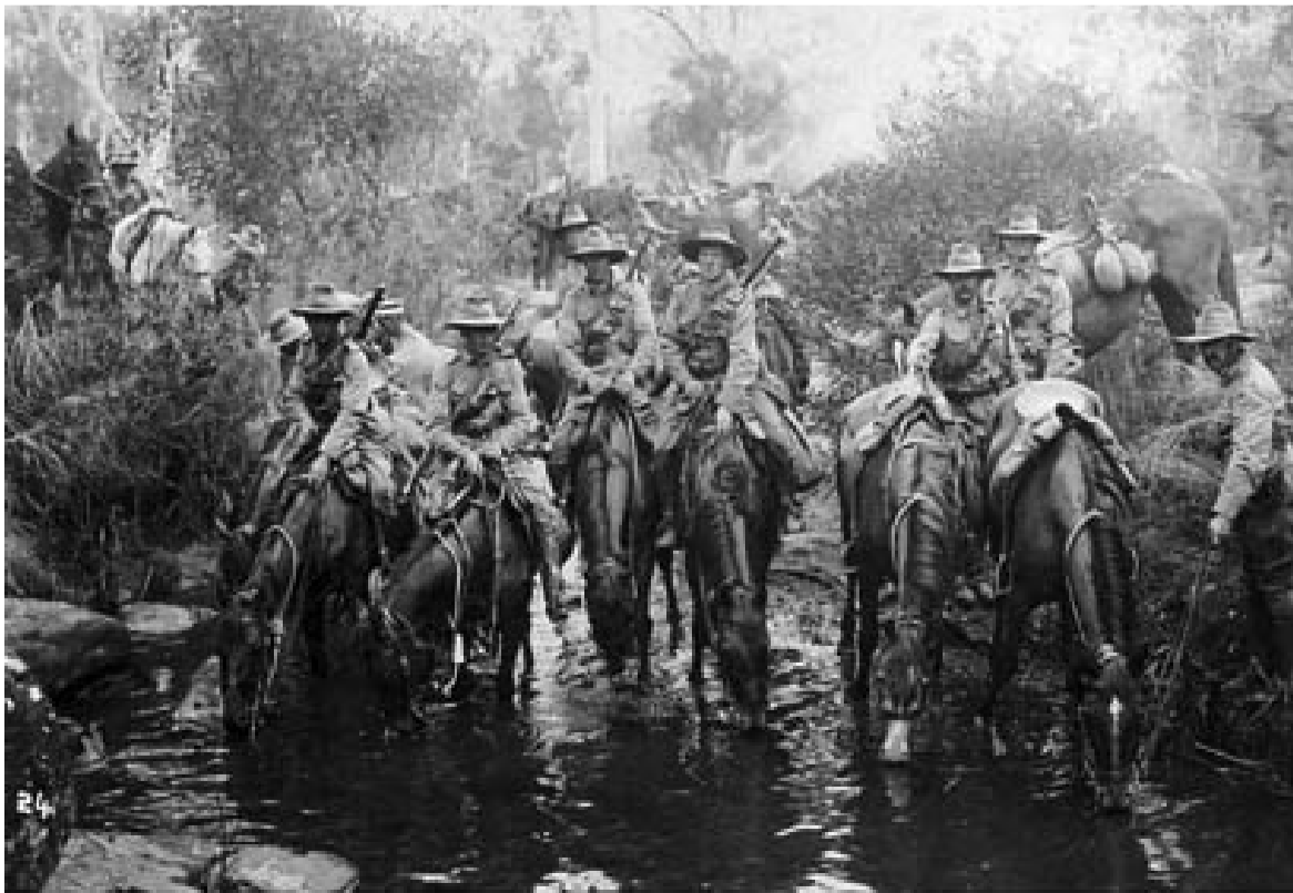
Light Horse Training, c.1910

1915 október 17-én a 8-ik könnyű lovas regiment vezetésére kapott utasítást alezredesti rangban. A gallipoli visszavonulás során negyven katonával visszamaradt fedezni a távozó regimentet. A parancs szerint tartani kell a lövészárkokat minden áron éjjel után 2.30-ig. Erről azt írta: „Szerecsémnek tartom, hogy vezethetem az utolsó csoport visszavonulását a lövészárkokból, ami dicső feladatot a 3-ik könnyű lövész szakasz kapta.”