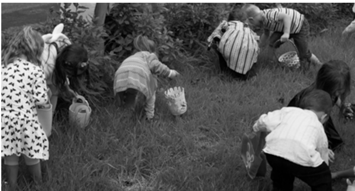
Húsvéti tojás keresés

Rendezze születésnapját, névnapját, családi összejövetelét a vasárnapi ebédek keretében a Bocskai Nagyteremben.