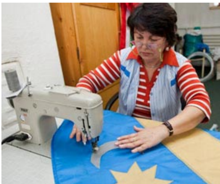
Varrják a székely zászlót világszerte

Ez lehet a székely autonómiáért elindult összefogás kijelölt útja.