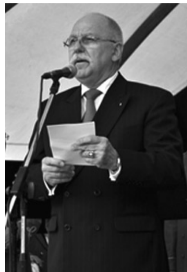
Fodor Lajos államtitkár

lyével. Az itt élő lengyel családok gyermekei számára – Európában egyedülálló módon – alapították meg még 1939-ben a Lengyel Gimnázium és Líceumot , amely szintén az akkori magyar kormány támogatását élvezte. Ebben az iskolában mintegy 600 fiatal jutott a világháború alatt érettségi bizonyítványhoz. E iskolát a mai napig meglátogatják a ma még élő, magukat bogláriaknak azaz boglarczykoknak tartó lengyelek.