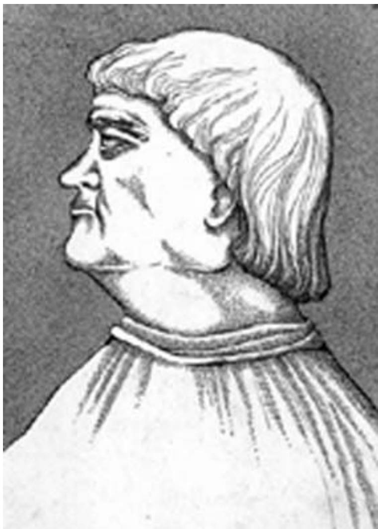
Bakócz Tamás negyed századon át irányította az országot (Muhí Sándor rajza)

„Azon államférfiak között, akik Magyarország sorsát intézték, alig van egy is, aki a hatalmat oly’ teljes mértékben bírta, mint Bakócz Tamás ” — írta Fraknói Vilmos az esztergomi érsekről, aki ötszáz éve kis híján római pápa lett. Akkor a hódító törökök és a felemelkedő Habsburgok közé szorult Magyarország sorsa is talán másként alakult volna.