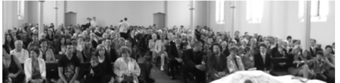
Karácsonyi gyülekezet a Nth. Fitzroy-i Magyar Templomban