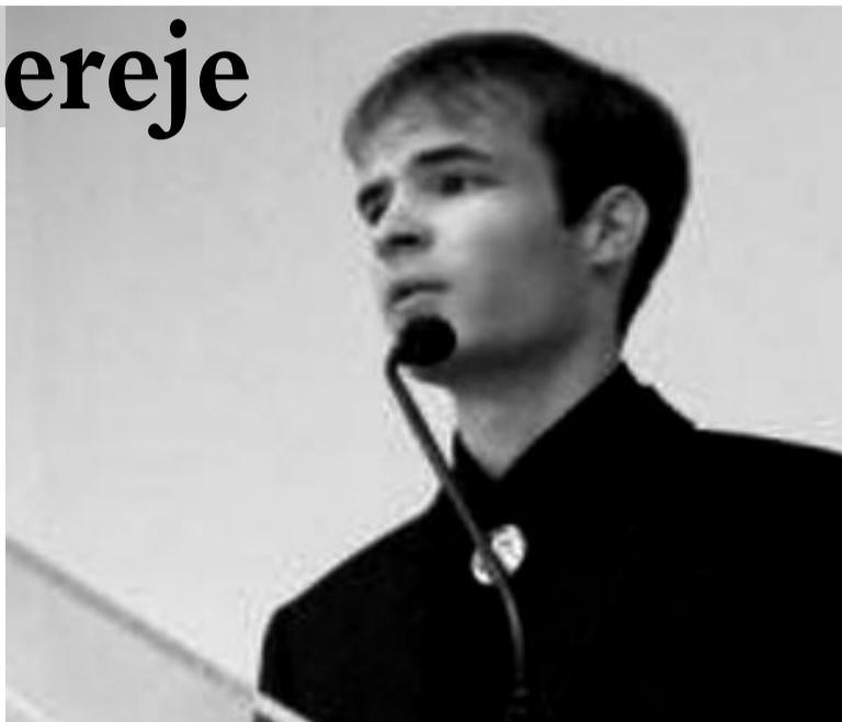
Fiatalok rendezik a trianoni megemlékezéseken a Nemzeti Összetartozás Napját

– Mára több ezer határon túli magyar kapta meg, kapta vissza a magyar állampolgárságot, és kilencvenezren nyilvánították ki szándékukat erre – mondta Németh Zsolt külügyminisztériumi államtitkár a főváros XXII. kerületében tartott nemzeti összetartozás napi ünnepségen. – Új szél fúj a Kárpát-medencében, az összetartozás és a közös felemelkedés szellemének szele –