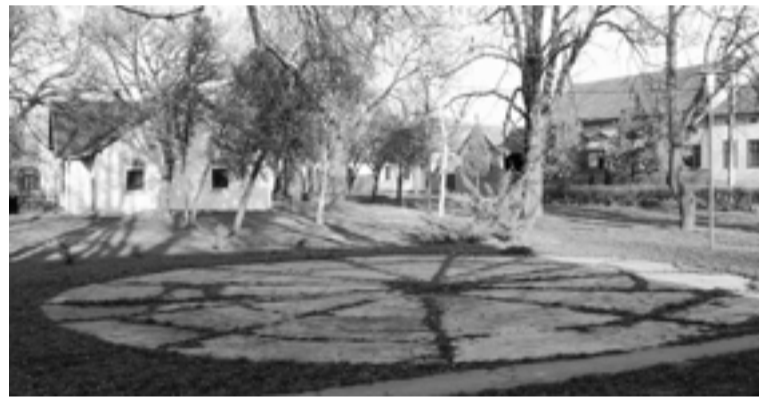
Ennyi maradt a tánckertből