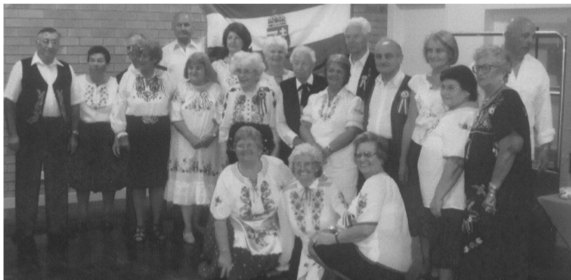
A Gold Coast-i Magyar Nyugdíjas Klub tagjai is megemlékeztek Nemzeti Ünnepről, Március 15-ről

A megnyitó előtt és után, a Nagyteremben terített asztalok és a VARDOS trio zenéje mellett, lehetett fogyasztani az étlapból: gombapaprikás- nokedlivel, töltöttkáposzta, túróscsusza. A jó vacsora elfogyasztásával, miután szomjukat enyhítették a „Csárdában”, válogatni lehetett a „Süteményes Sátor” finomabbnál-finomabb házisüte-