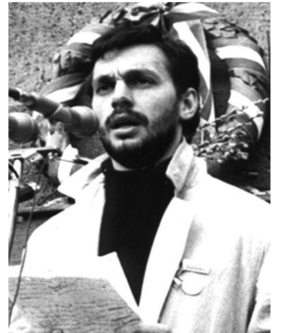
Orbán Viktor ünnepi beszédét mondja 1989. március 15-én.

Kiemelte ugyanakkor, hogy az ország felemelkedéséhez nem elég az új alkotmány, „a jól megépített hajótest”, „nagy teherbírású hajtóművekre” is szükség lesz. Kell hozzá a Széchenyi-terv, a Széll Kálmán Terv és az Országos Munkaterv is, ezek mindenkit visszahoznak a munka világába, akit csak lehet – sorolta, hozzátéve –, hogy ha sikerül leküzdeni az