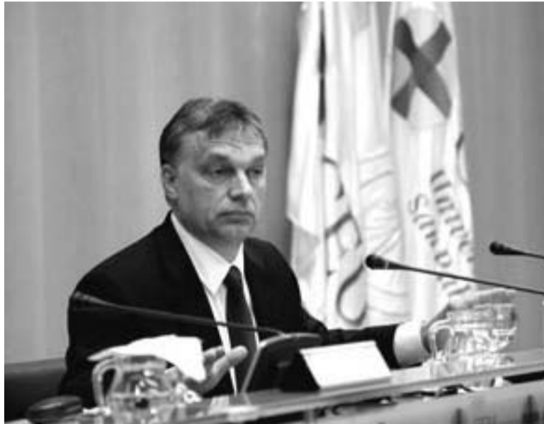
Orbán Viktor Madridban

létre, minél több országban, magyar mintára, az alkotmányba foglalt politikai katolicizmust vezesse be. Az Európai Unió liberális alkotmánya és Európa ellen indított támadás egyik vezéregyénisége Orbán Viktor, aki résztvett a legutóbbi római találkozón, ahol a pápa a Vatikán befolyása alatt álló európai jobboldali politikusoknak tartott eligazítást.