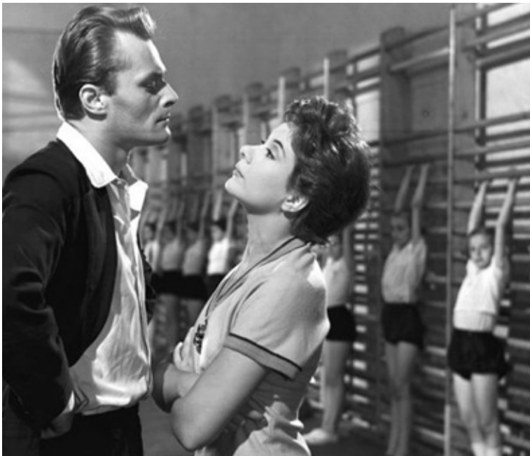
Mese a 12 találatról - Darvas Iván, Ruttkai Éva 1956

nélkül a tízezres néma tömeg előtt, majd este a Parlamentnél a már kétszázézerre nőtt tömegnek szavalt. Ezzel az 1956-os megmozdulás jelképévé vált. Mivel személye nemzetközileg is fókuszba került, börtönbüntetést nem kapott. Előbb felére csökkent