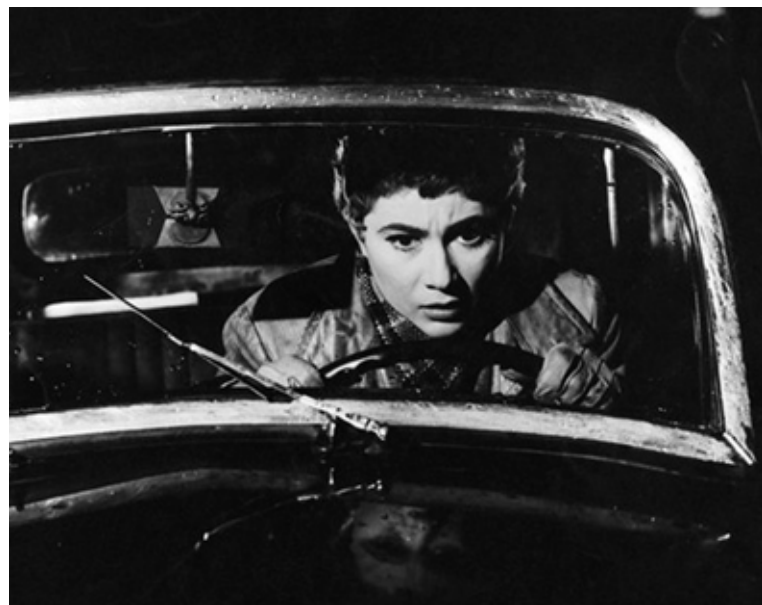
Gázolás - Ferrari Violetta 1955