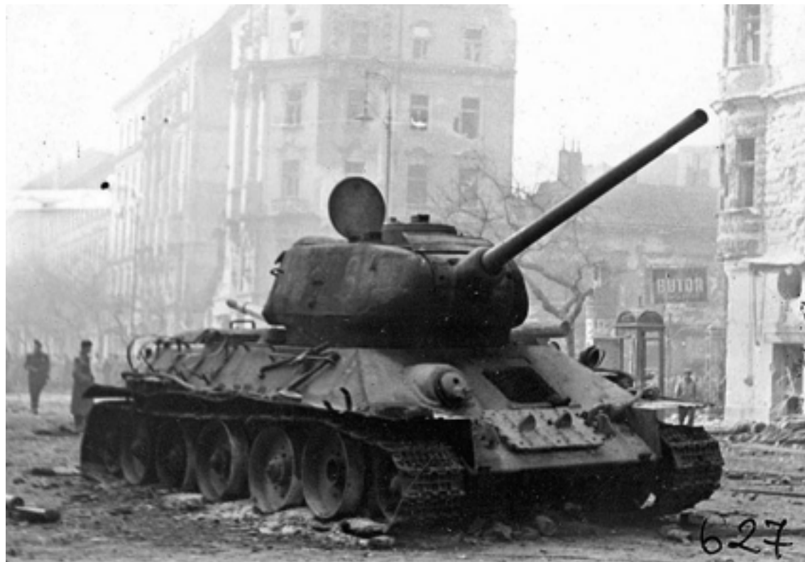
Lárma és csend, lelkesedés és szorongás

szól a rádió, amerre megyek, hallom a szöveget. Mindig ugyanazt: a szolnoki kormány felhívása, ellenforradalom, kértük a szovjet csapatok segítségét... Minden ablakból ugyanaz, újra és újra...”