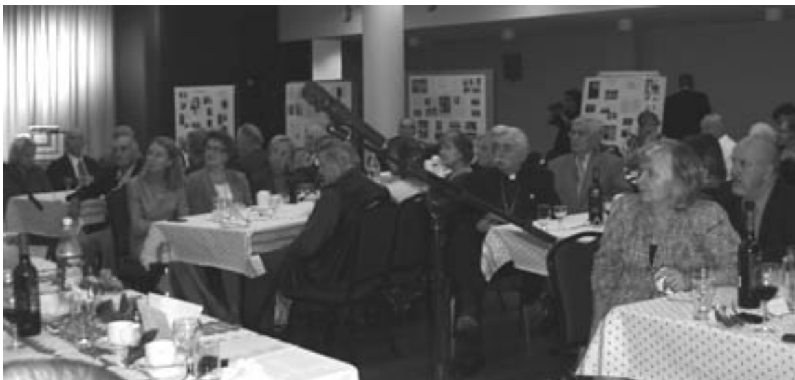
A hallgatóság egy része, háttérben Yaroslav Stetsko tevékenységét bemutató kiállítás

Dr. Kvit és az általa vezetett egyetem állandó küzdelmet folytat az oktatási miniszterrel, Dmitry Tabachnyk kal, aki – szerinte – tönkreteszi az oktatási rendszert, lealacsonyítja vagy