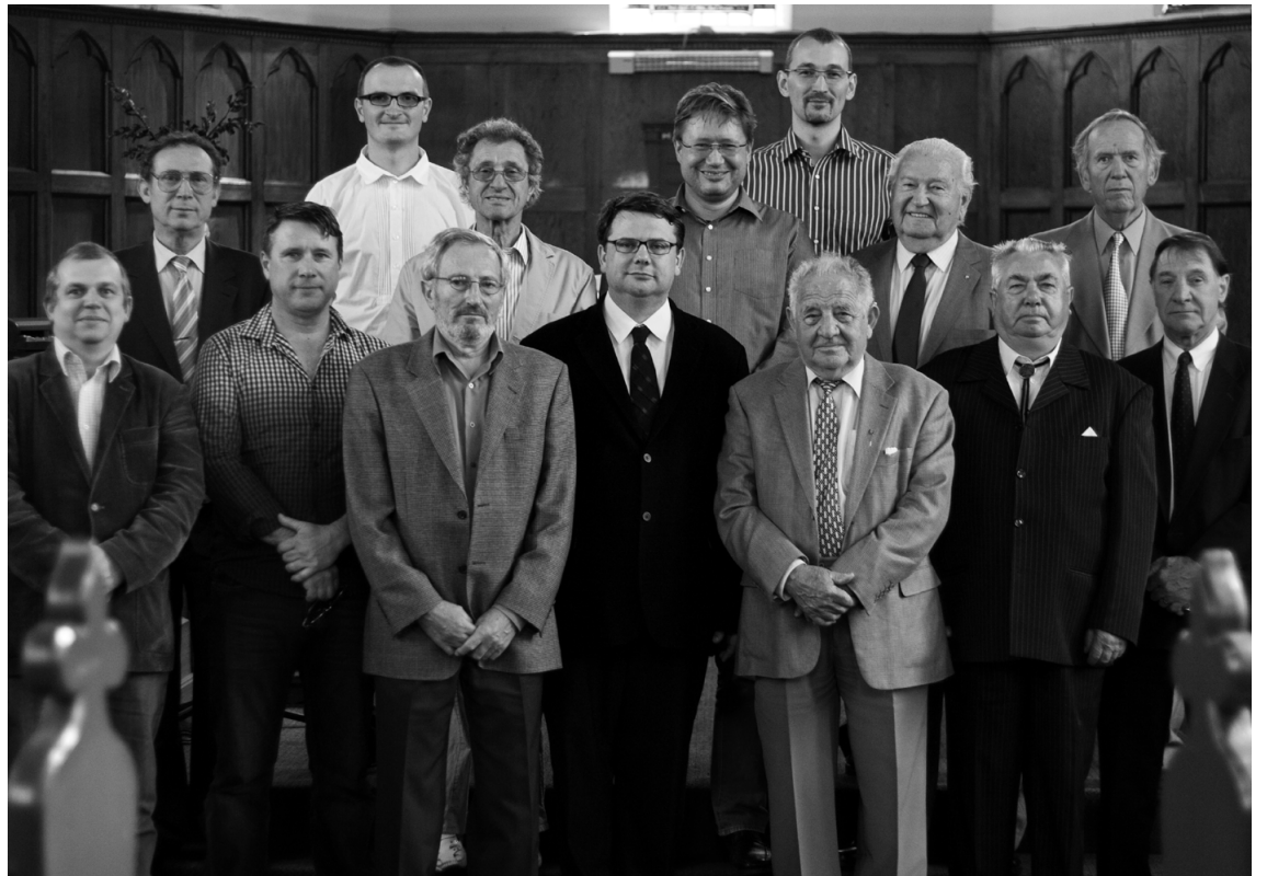
A North Fitzroy-i gyülekezet presbitériumának április havi ülésén résztvevő presbiterek.

Telefon: (03) 9439-8300 — (03) 9481-0771