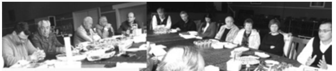
Az évi lelkész találkozót megnyitó bibliaóra résztvevőinek egy része.