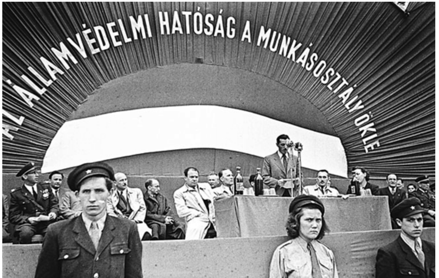
Elszánt fiatalok a kommunisták terrorszervezete, az ÁVH 1949-es ünnepségén. A főasztalnál három hóhér ül: Farkas Mihály, Kádár János és Péter Gábor

Áprilisig feláll az a bizottság, amelynek feladata lesz a kommunista hatalmat birtokló személyek és szervezetek szerepének feltárása. Az új alaptörvény szerint már most is fel lehet jelteni a rendszer bűnöseit — mondja Gulyás Gergely (Fidesz) a kommunizmus áldozatainak hazai emléknapján.