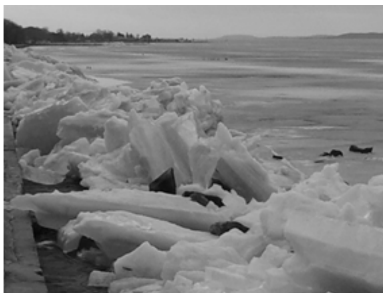
A Balaton északi partja február végén