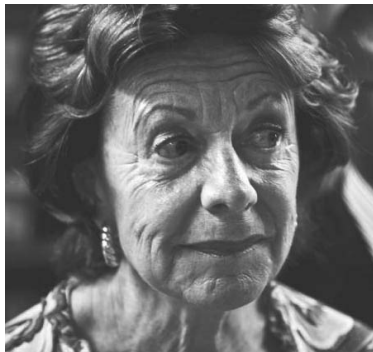
Ms. Neelie Kroes

a magyar miniszterelnök-helyettes látatlanban kötelezze el magát. És Neelie Kroes biztos asszony van felháborodva akkor, ha Navracsics Tibor erre azt feleli, akkor tudja csak elfogadni, ha az ajánlás nem ellentétes azzal a magyar alkotmánnyal, amelyre felesküdték.”