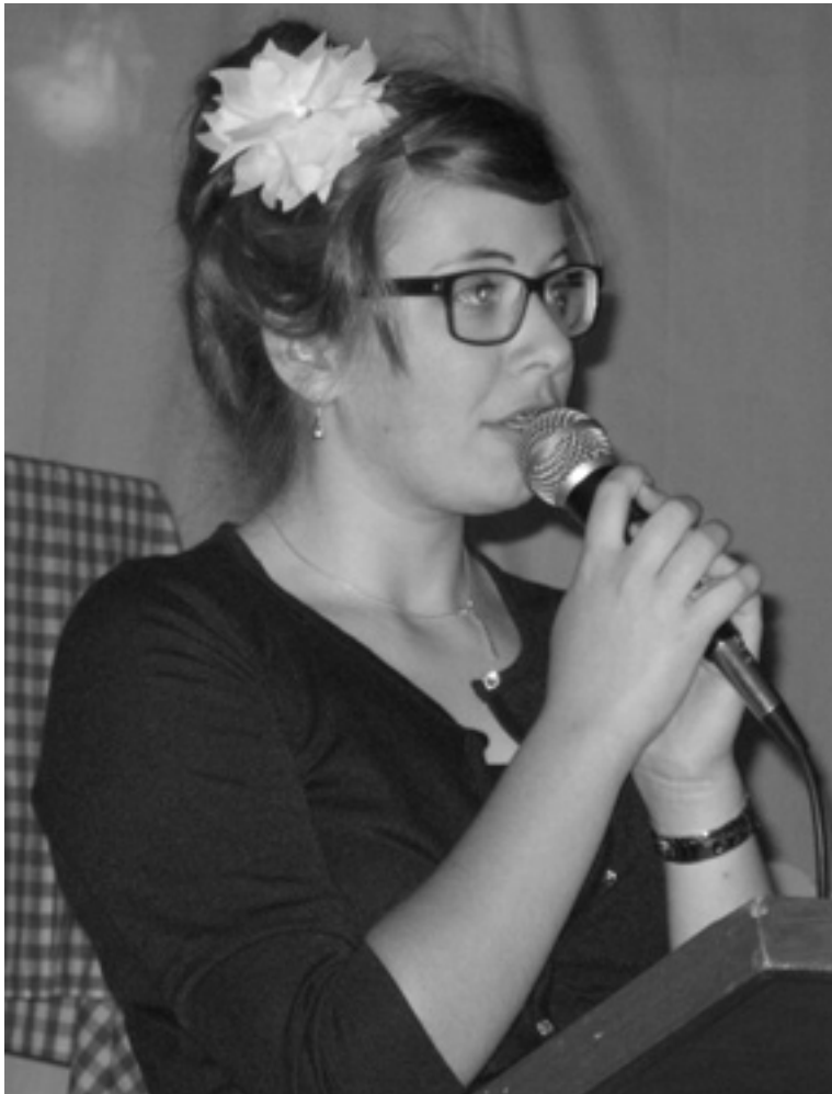
Toldi Bianka énekel