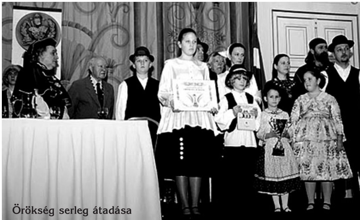
Örökség serleg átadása

A gála szervezői és a vendégek egybehangozva sikeresnek ítélték a rendezvényt, és bíznak abban, hogy ez a magyar nemzetet a maga természetességében, organikus összefogó rendezvény – mint az Európai Unió példaértékű eseménye – elnyeri az erkölcsi és anyagi támogatottságot, és hogy ahhoz való további feltételek megteremtése a következő évben kedvezőbb lesz.