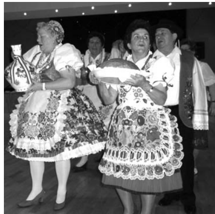
Megsült az új kenyér