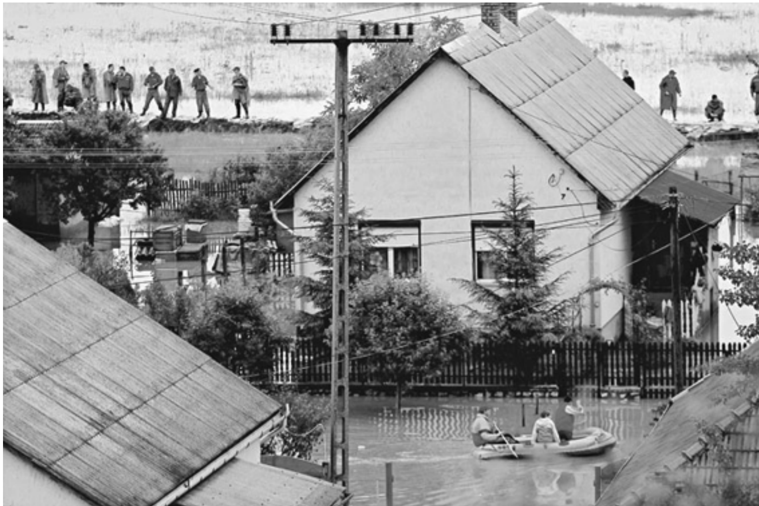
Víz fenn, víz lenn. Borsodban tízezrek dolgoznak éjjel-nappal, hogy megvédjék a településeket

A napokban olvastam Trianon kapcsán a korabeli publicisztikákat. A szerződés aláírásának napján nem az jelentette az akkori magyar újságíró-társadalom legnagyobb gondját, hogy miként fognak mindent visszaszerezni,