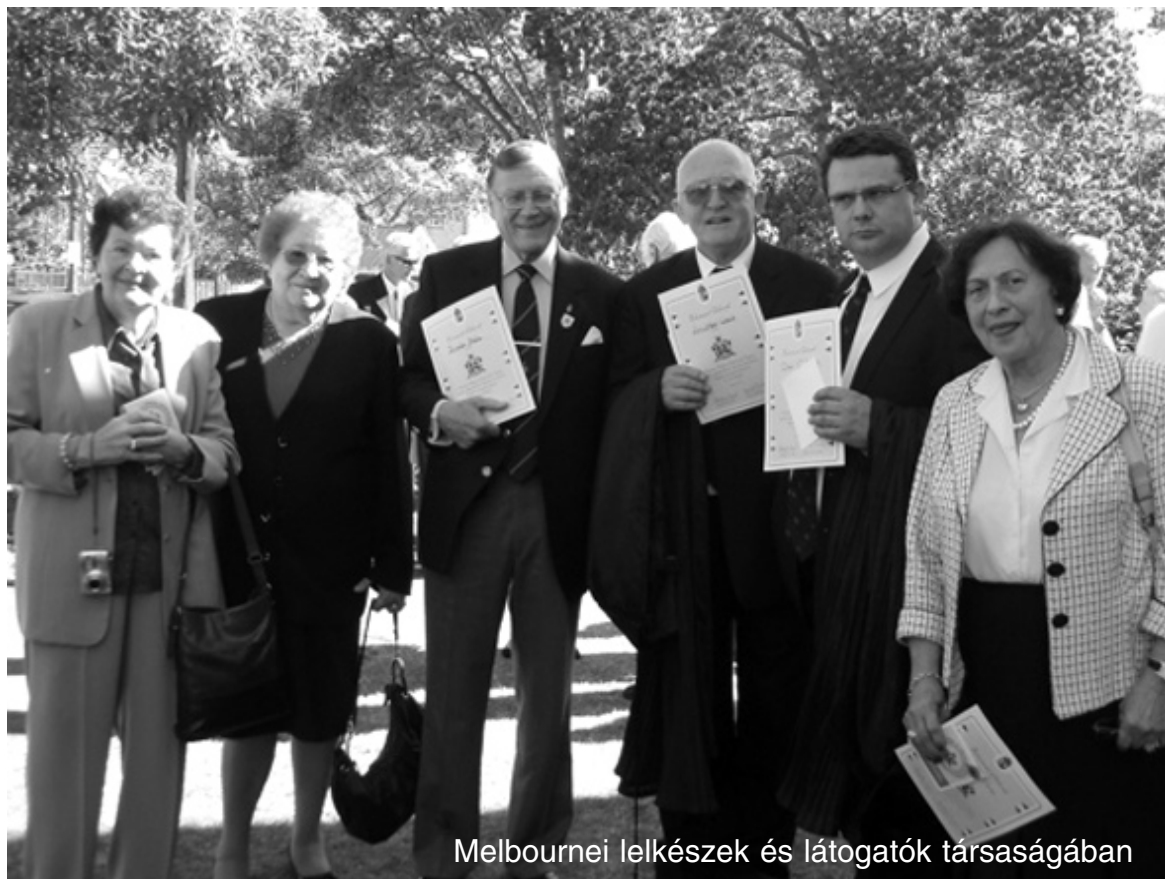
Melbournei lelkészek és látogatók társaságában

• Rendszeres tájékoztatást kapunk a második Orbán-kormány felállításáról, és tervezett előkészületeiről a kormányzás átvételét illetően.