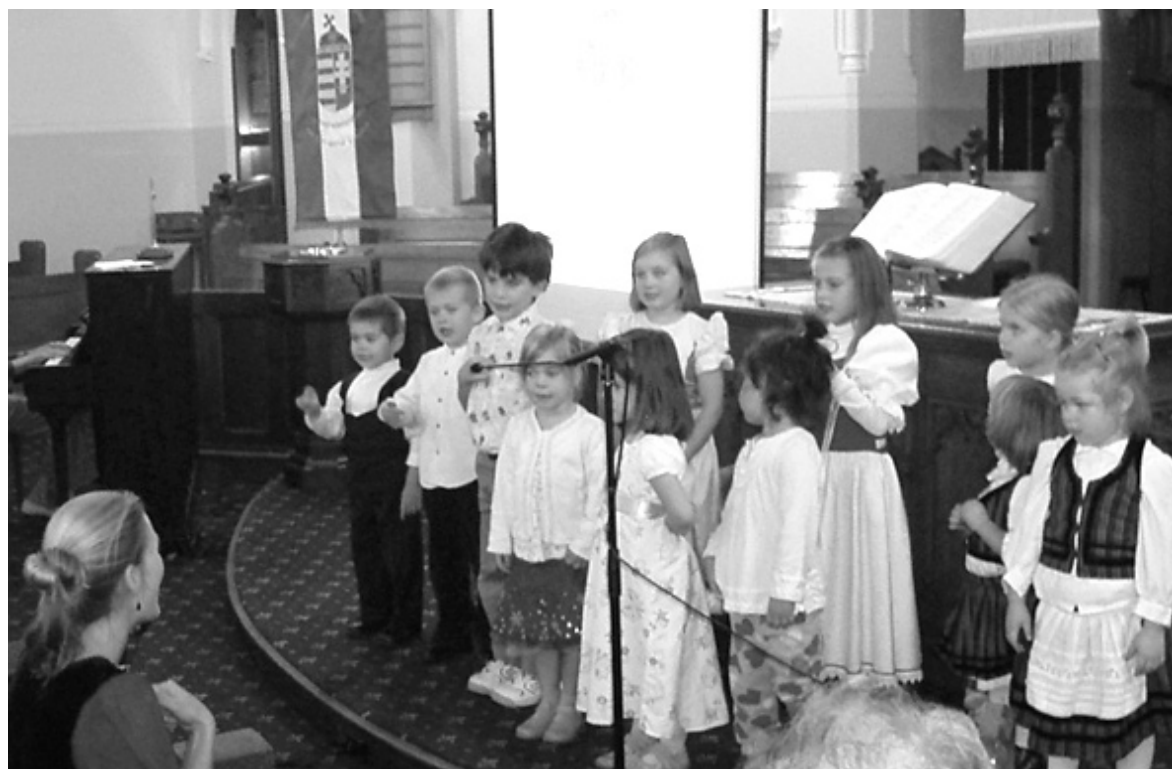
Vasárnapi iskolások köszöntik az édesanyjüket