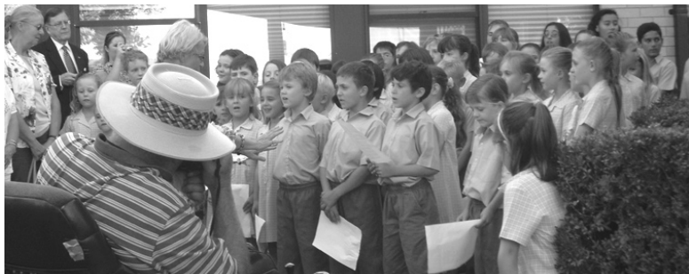
A Magyar Himnuszt éneke a St. Raphael Iskola gyermekkórusa a Békeharang tövében