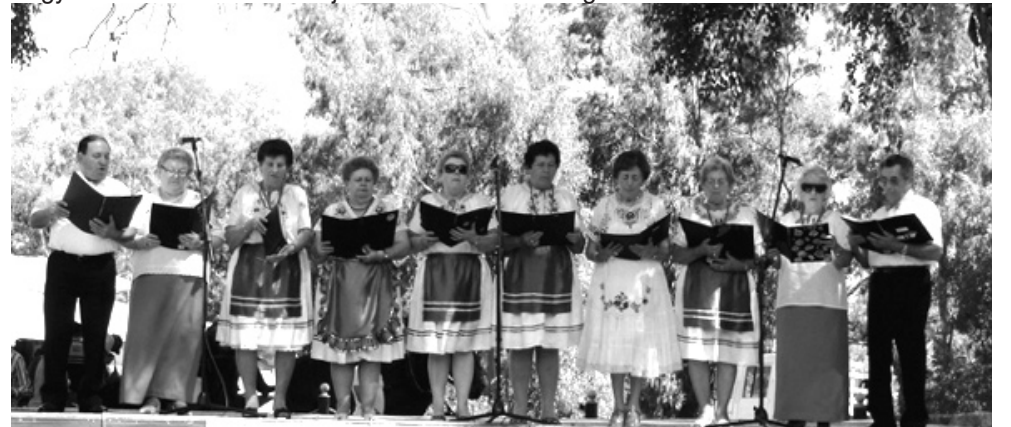
A Sydney-i Délvidéki Magyar Szövetség Ének-kara magyar nótákkal szórakoztatja a karnevál közönségét