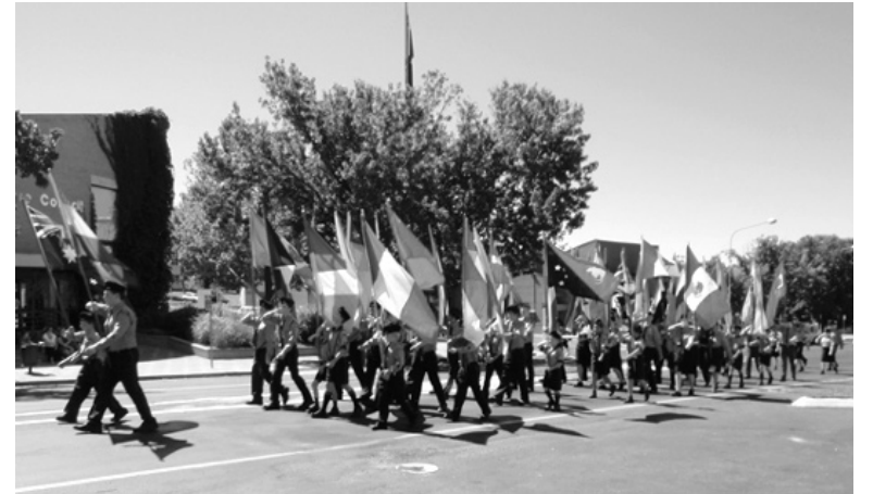
A cserkészcsapatok felvonulása a magyar és más nemzetek zászlói alatt