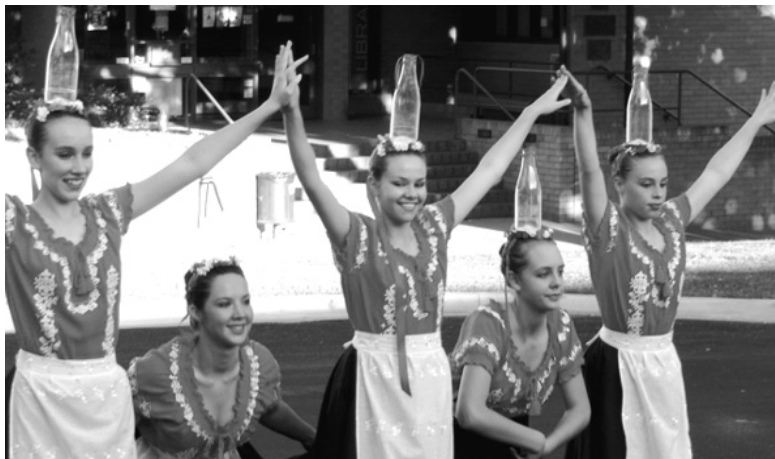
A Torsion Táncsoport üvegestánca