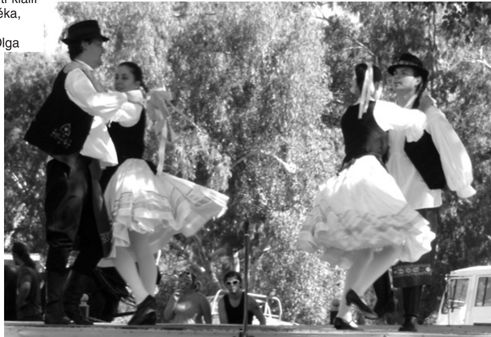
A Canberra-i Gyöngyösbokréta Táncsoport a karneválon

Visszatérve az eseményekre, szombaton délelőtt 10 órakor Csaba Gábor nagykövet, annak emlékére, hogy 2010-ben Magyarország volt a fesztivál vendége, virágos kőrifát ülte-