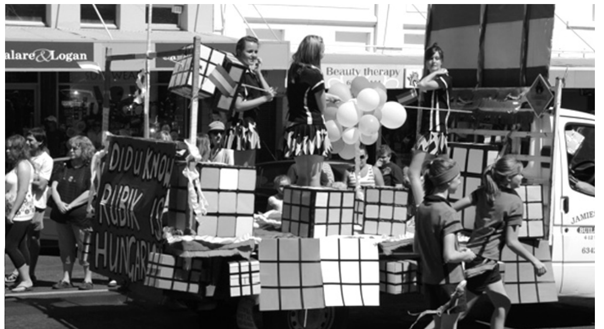
A Cowra Netball Association Rubik-kockás „float”-ja a felvonuláson