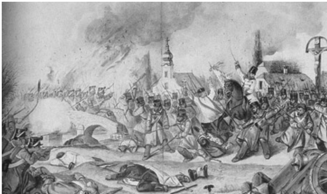
Sokáig úgy hitték, tévesen, hogy Görgey elkésett a kápolnai csatából