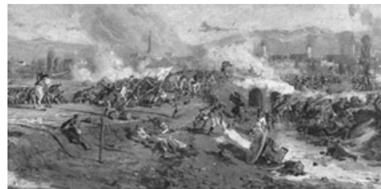
Nagyszzeben cseles bevétele után két héttel Bem apó honvédei egész Erdélyt felszabadították

Ha 1849 első három hónapjában nem foglalja vissza a túlerőben levő ellenségtől Erdélyt, és ezzel nem biztosítja a Debrecenbe menekült kormányt és a