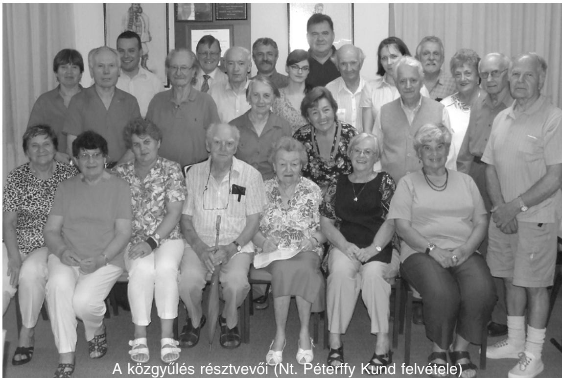
A közgyűlés résztvevői

A NSW-i Magyar Szövetség február 11-i közgyűlésén, Nagy László örökös tiszteletbeli tag korelnökségével, az alábbi vezetőség lett megválasztva: