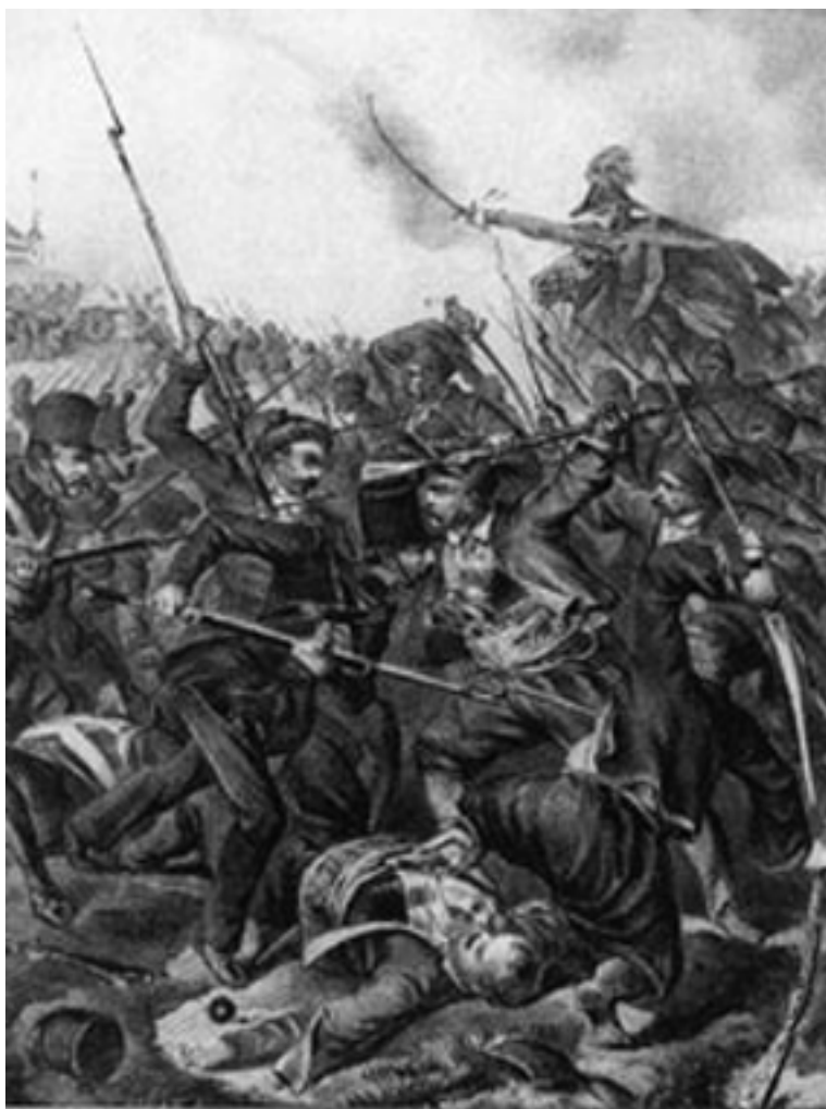
Szerb–magyar összecsapás a Délvidéken, 1848 nyarán

által megszállt Bácskát és Bánságot. A Todorovic tábornok vezette osztrák-szerb csapatok ugyanis 1849. január-februárban egészen Szegedig és Aradig nyomultak előre, s a szerb lázadók és a Szerb Fejedelemségből ezrével érkező fegyveres önkéntesek — rengeteg magyar polgári áldozatot követelő — kegyetlenkedései miatt szinte népvándorlás indult a bácskai falvakból észak felé. Az 1848 tavaszán Karlócán kezdődő lázadás vezetői a délvidéki területeken önálló szerb tartományt akartak létrehozni, és azt egyesíteni Horvátországgal, Szlavóniával és Dalmáciával. A június 12-i karlócai ütközettel megkezdődött szerb–magyar „kis háború” a magyar szabadságharc legtovább tartó és legvéresebb frontja volt.