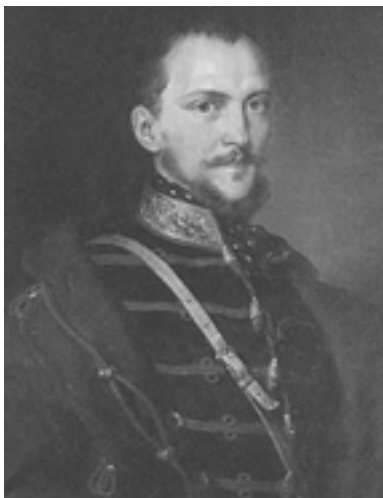
Görgey Artúr vezérőrnagy 31 évesen lett a honvéd főszereg parancsnoka