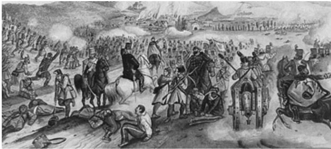
Görgey Artúr tábornok, a honvédsereg fővezére (balra, fehér lovon) az isaszegi csata egyik legválságosabb pillanatában megállítja Klapka György tábornok, hadtestparancsnok (középen) visszavonuló csapatait

Ha az Aszódon (a haditervnek megfelelően) egész nap várakozó 7. hadtest öntevékenyen támadást indít északkelet felől Gödöllő felé, akkor az ellenségnek aligha lett volna ideje, hogy kikerülje a Görgey szerint „csaknem bizonyos katasztrófát”. A császári hadsereg így is a legnagyobb — bár nem döntő — vereségét szenvedte el Isaszegnél a szabadságharc kezdete óta.