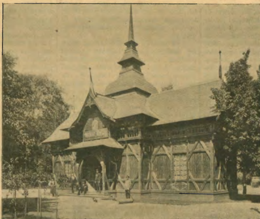
232. ábra. Torontál vármegyei paviljonja az ezredéves kiállításán.

A legeltesek a völgyekben és a hegyek lábainál májusban kezdődnek és 3—4 hétig tart; ezután az állatot fokozatosan mindig feljebb és feljebb tereltetnek s a legelső Álpokon 8—12 hétig maradjak, majd fokozatosan ismét lejjebb-lejjebb hajtattak, úgy