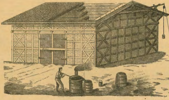
230. ábra. Wangenheim-féle tőzegmoha-fedél.

A pavillon jobb szárnyán belépve, egy előcsarnokba jutunk. Itt találjuk az ország különböző vidékeiről és a külföldről összejuttatott buzamintákat, a belőlük készített liszt és korpát, a chemiai elemzés és a liszt sültétségének feltüntetésével. Itt látjuk a termelésre használt talajok mechanikai és chemiai összetételét feltüntető táblázatokat.