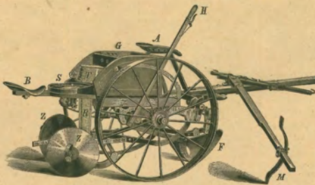
170. ábra. Robbin-féle amerikai burgonyavetőgép.

Az ezredéves kiállítás nagy gépészmunkában egy évben levő új szerkezetek sornozóját vonja magára a közönség figyelmét, a mely annyival is inkább megérdemli a gazdák érdeklődését is, mert ez a gép a mezőgazdaságban előforduló cséplési s ly-