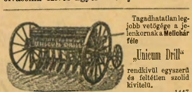
Tagadhatatlan legjobb vetőgépe a jelemkorán a Melichar féle „Unicum Drill” rendkívül egyszerű és feltétlen szilid kivitelű. 1447

Lapunk mai számához Weigl J. preram kocsiorgó prospectusa van csatolva, melyet olvasóink szives figyelmébe ajánlunk.