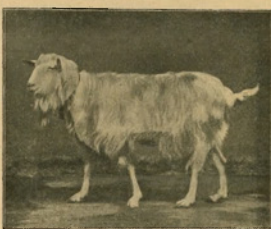
100. ábra. Saaneni kecskebak.

Figyelembe véve ezen itt felsorolt eseteket, azáltal már lehet következtetni azono területre, mely évenként rendelkezésre áll a gőztalajmívelés számára. De a terület nagyságán kívül ismerni kell a gőzeke napi munkabírását is, hogy egyrészt az évi munkanapok száma, másrészt maga a munka kellően felosztható legyen.