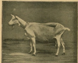
100. ábra. Saaneni kecskegida.

E három főben eseten kívül maradhat még az őszi szántásból is bizonyos rész a gőzeke számára. Közönséges szántásra az igerővel egyrtésben. Az őszi szántás különösen nedves őszién vagy a késői szántással előnyös a gőzekekre nézve, mert ilyenkor az iga nehezen tud dolgozni.