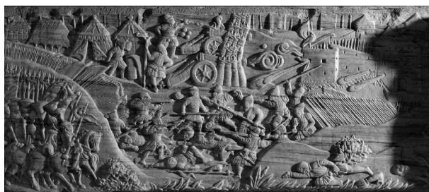
János Zsigmond síremléke. Északi (jelenleg: keleti) oldal. Részlet