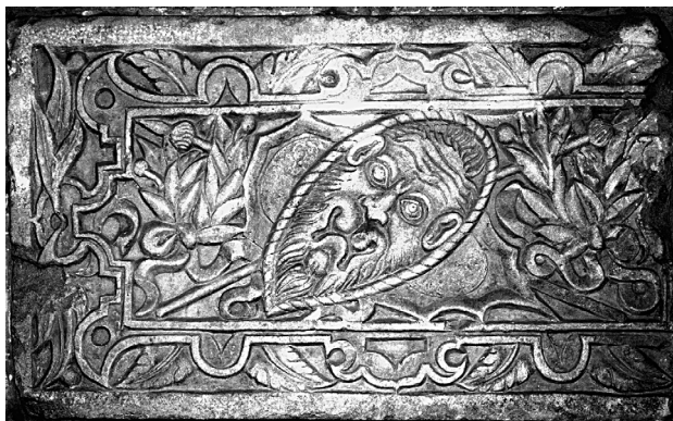
Kendi Ferenc és Antal síremléke. Töredék

polyai-ház címerére. Férfi halottakat megillető vicsorgó oroszlán ágaskodik az elhunyt bal lába és kardja mellett, mögötte – funkciótlanul – a címertartó puttó párja is feltűnik.