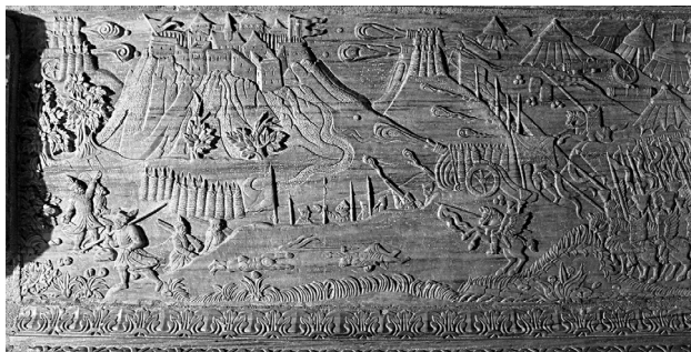
János Zsigmond síremléke. Déli (jelenleg: nyugati) oldal

ostromának mindjárt két mozzanatát vélte azonosítani. Kővárát 1567-ben János Zsigmond jelenlétében foglalták el a Bebek György vezette erdélyi csapatok. Az azonosítás ebben az esetben is az elhunyt személlyel kapcsolatos történet önkényes kiválasztásán alapszik. Nyilvánvaló, hogy nem elég a két eltérő domborműhöz János Zsigmond uralkodása alatt lezajlott csatát vagy ostromot társítani, a társítást a dombormű részleteivel alá is kell támasztani; bizonyítani például, hogy azonosítatlan előképek valóban Erdélyhez, s ott éppen a kiválasztott helyhez kötődnek.