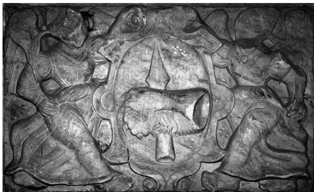
Kendi Ferenc és Antal síremléke. Töredék

kiképzésük, díszítésük módja, egymáshoz való viszonyuk ugyanis a végrendelet szövegével egyetemben arra utal, hogy mindkettő a testamentumos urak, a fejedelmi végrendelet végrehajtói – Csáky Mihály (1492–1572), Hagymási Kristóf (1510–1577), Bekes Gáspár (1520–1579) és Stanisław Nieżowski (1520 k. –1573), valamennyien unitáriusok 35 – megrendelésére készülhetett el az ifjú fejedelem halála után, talán – tekintettel a végrehajtók sorsának alakulására is – még 1572 előtt. A tumbák Erdélyben szokatlan kőanyagára és stílusára találunk még példát az 1559-ben meggyilkoltatott s eredetileg Gyulafehérvár külvárosi templomában 36 eltemetett Kendi fivérek szintén 1571 után állított székesegyházbeli közös tumbájának fennmaradt két, egykor a sírláda rövid oldalait képező töredékén is. 37