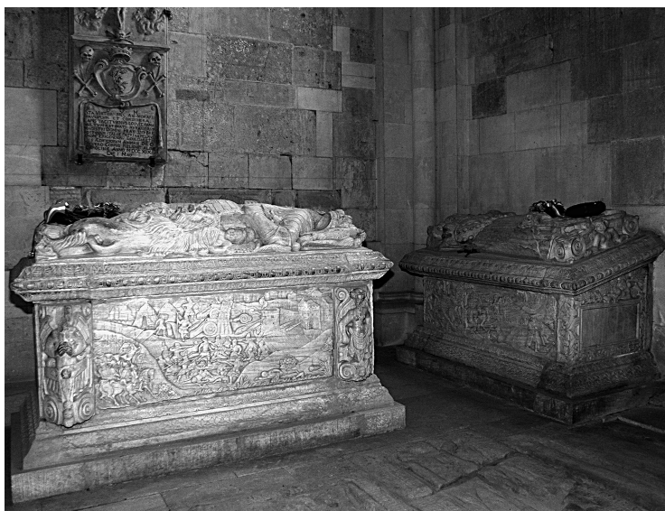
János Zsigmond és Izabella síremléke.

Gyulafehérvár, római katolikus főszékesegyház