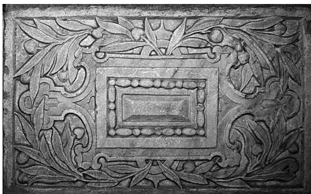
János Zsigmond síremléke, déli (jelenleg nyugati) oldal

II. Frigyes dán király (1559–1588) általi ostromát ábrázolja. 25 Minthogy ennek az első balti háborúnak a dán király szövetségeseként részese volt János Zsigmond nagybátyja, Zsigmond Ágost lengyel király (1548–1572) is, nem kizárt, hogy az elhunytáig királyi rokona egyedüli utódának és örökösének számító János Zsigmond síremlékének a domborműveit is ilyen, lengyel vonatkozású forrásból származó metszetelőképek inspirálták.