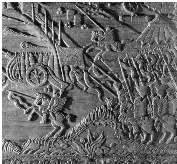
Lengyel szárnyas huszárok. János Zsigmond síremléke. Részlet

díszített) zászlóját lobogtatja a szél. Az ostromjelenet a Báthory István lengyel király (1576–1586) uralkodása alatt önálló fegyvernemként hadrendbe szervezett, de kétségkívül korábban is létezett – így elméletileg korábbi ábrázolásokon is előfordul – nehézlovasok szereplése révén mindenképpen lengyel vonatkozású, ha metszetelőképét nem is sikerült mindeddig feltalálnunk. Az egykori északi oldalon található dombormű stílusában, különösen ábrázolásainak részleteiben közel áll egy névtelen metszethez, amely a hétéves vagy első északi (ún. háromkorona-) háború (1563–1570) egyik mozzanatát, a svéd Älvsborg várának