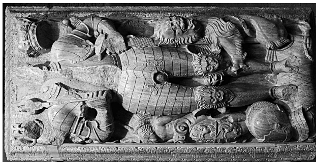
János Zsigmond síremléke

díszes, egymástól részleteikben is eltérő manierista hermák (egyikük elpusztult, tömegét a modern restaurálás jóvoltából csupán méreteit idéző kőhasáb érzékelteti) határolják a kétségtelenül fametszetes kompozíciókról felnagyított s a minta apró, kőfaragványban nehezen érvényesülő részleteihez is szemmel láthatóan hűségesen ragaszkodó, domborműben ábrázolt jeleneteket.