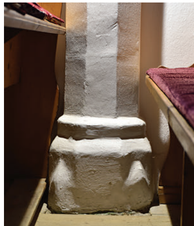
9–10. Faloszlopfejezet Suky-címerrel és ennek lábazata