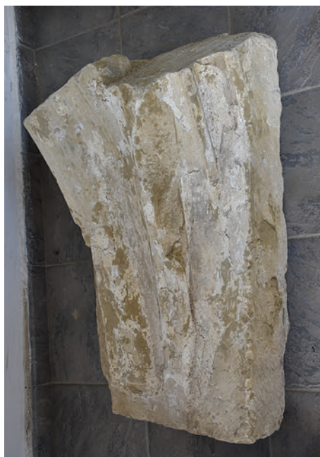
34–35. K6 – bordás keresztboltozat rétegekőve feltehetőleg a szentélyből