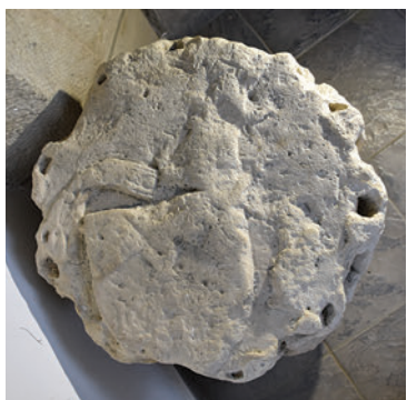
7. Boltzárókő pápai címerrel