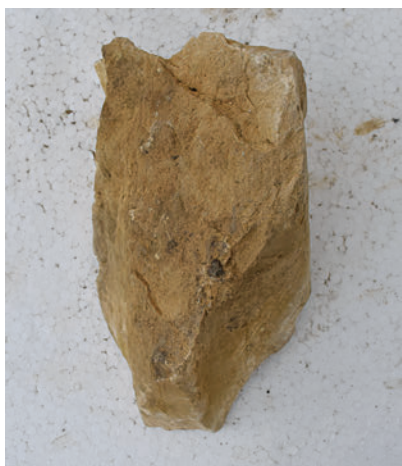
58. K19 – bordatöredék