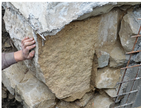
62. S4 – a hajóboltozat réteggöve