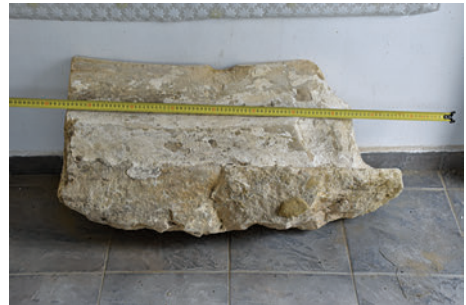
40–41. K9 – egyes bordaindítás a kiemelés előtt és után