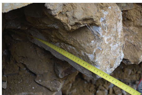
61. S3 – körtetagos borda