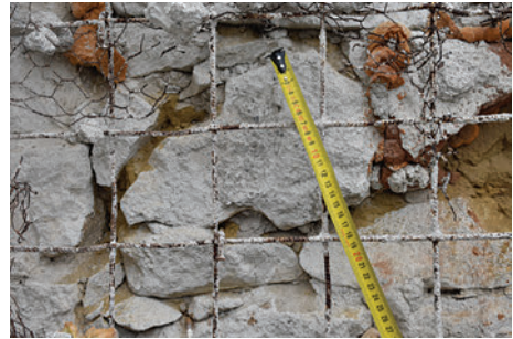
71. S15 – boltozati borda