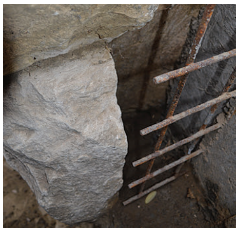
66. S6 – a hajó boltozatának rétegeköve (?)