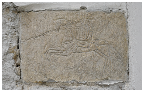
78. Kváderköbe karcolt lovag a nyugati homlokzaton