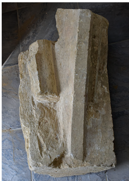
36–37. K7 – bordás keresztboltozat alsó rétegekőve feltehetőleg a szentélyből