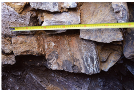
65. S9 – a hajó boltozatának rétegeköve