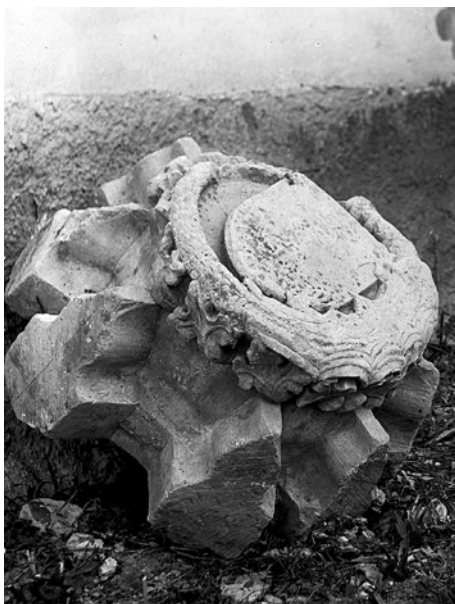
4. Boltzárókő 1910-ben (Dunky fivérek)