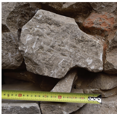
67. S7 – körtetagos borda töredéke