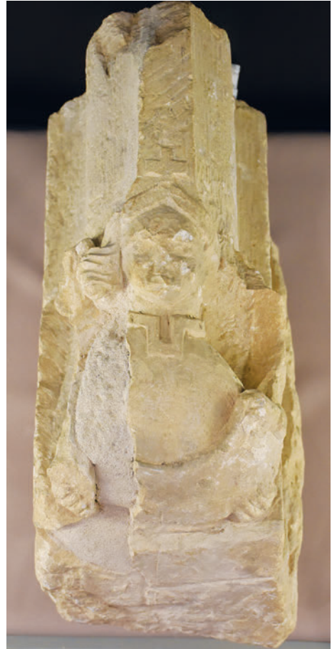
38–39. K8 – angyalalakos boltozati konzol valószínűleg a szentélyből, kiegészítés előtt és után