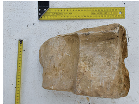
50–51. K16 – körtetagos borda töredéke