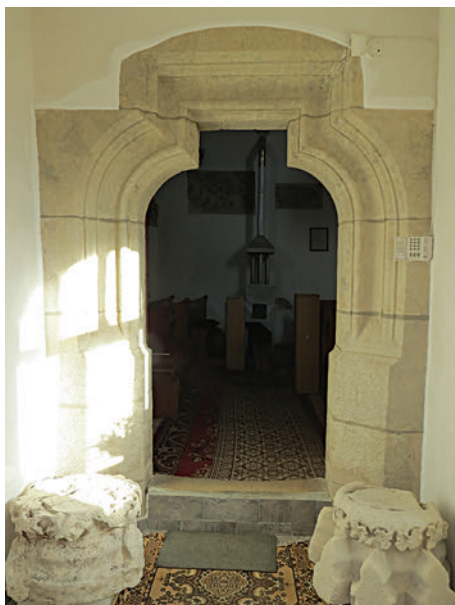
16. A déli bejárat