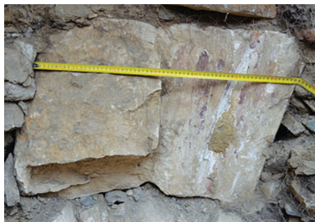
59. S1 – a hajó boltozatának réteggöve