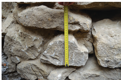
68. S10 – körtetagos borda töredéke