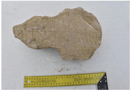
49. K15 – körtetagos borda töredéke