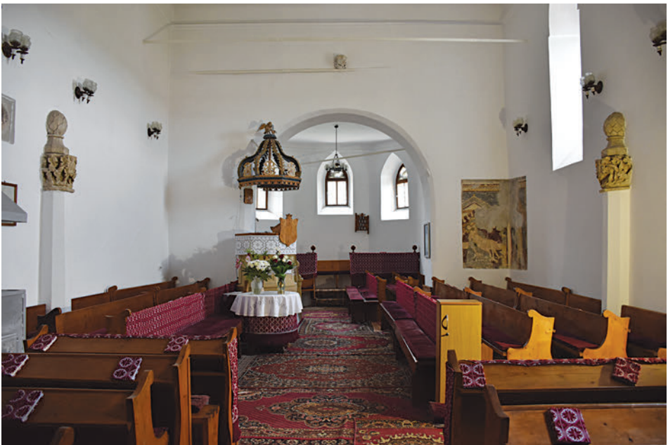
2. A magyarorszáti templom belső tere