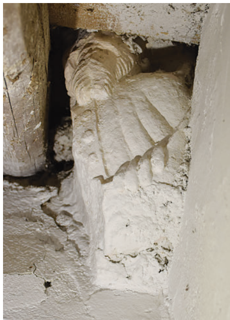
13–14. Alakos boltozatindító konzolok a hajó nyugati sarkaiban