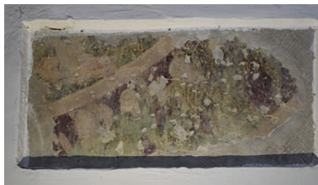
74–75. Utolsó ítélet, töredékek a hajó északi oldalán