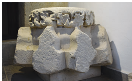
5–6. Boltzárókő kettős kereszt címerrel restaurálás után