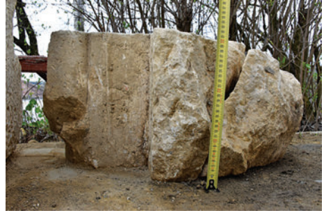
28–29. K3 – hármas bordaindításos réteggő a hajó boltozatából