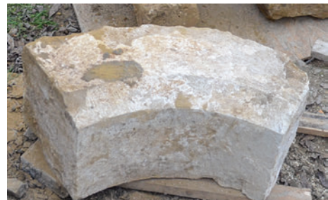
52–53. K17 – nyíláskeret archivoltjának eleme