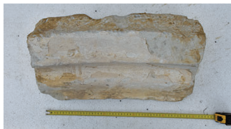
44. K11 – körtetagos borda