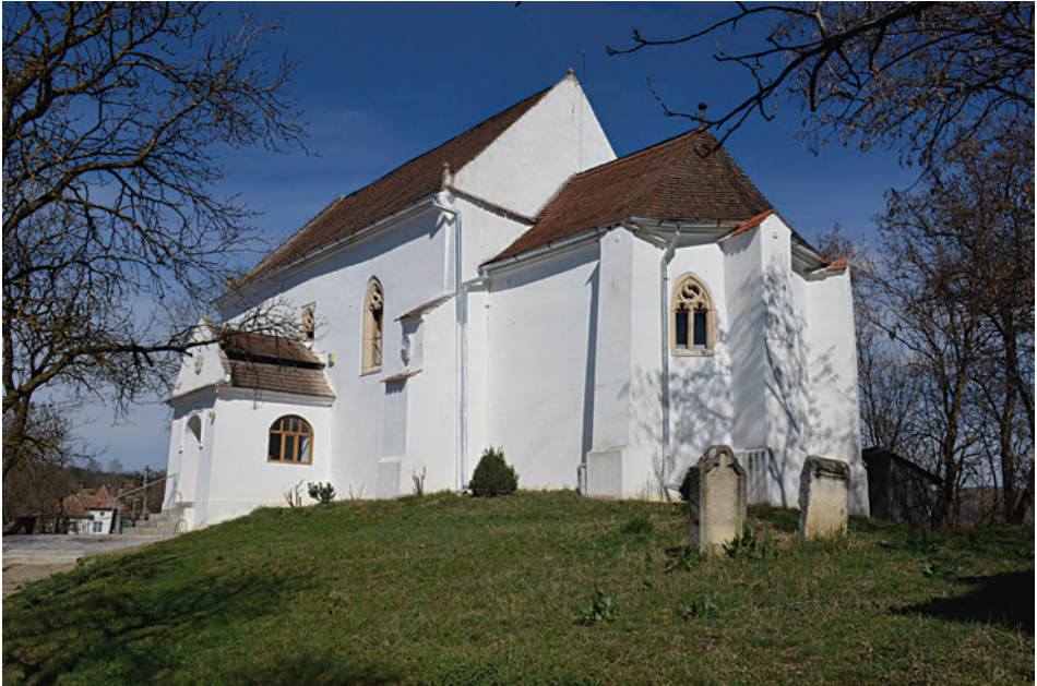
1. A magyarorszáti templom