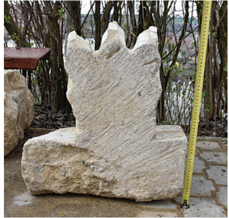
30–31. K4 – hajó gótikus boltozatának réteggőve