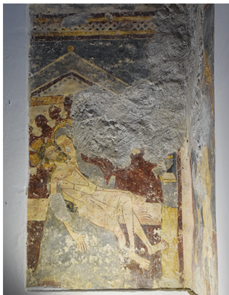
76. Pietà-ábrázolás, falkép a diadalív déli oldalán