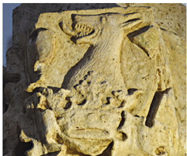
11. A címerpajzs a faloszlopfejezeten