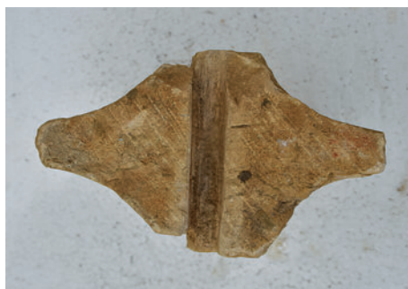
42–43. K10 – hornyolt profilú ablakosztó töredéke