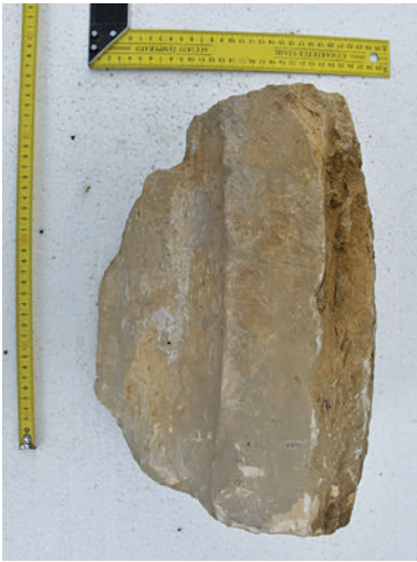
48. K14 – körtetagos borda töredéke