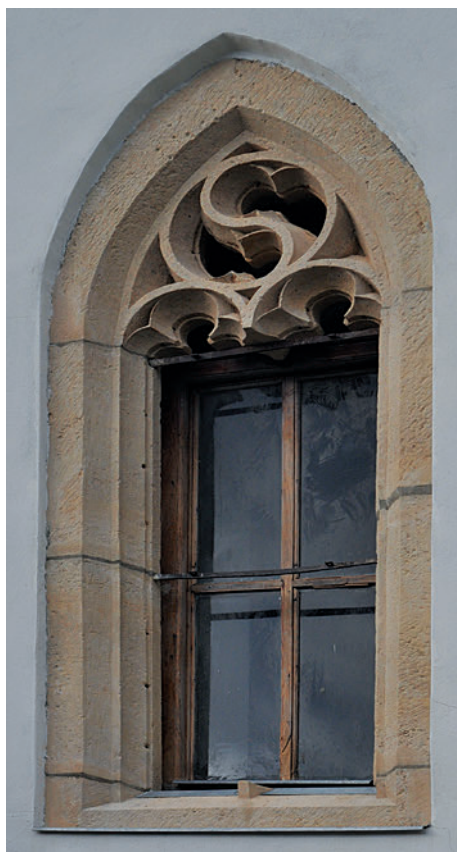
18. Gótikus ablakkeret a hajóban