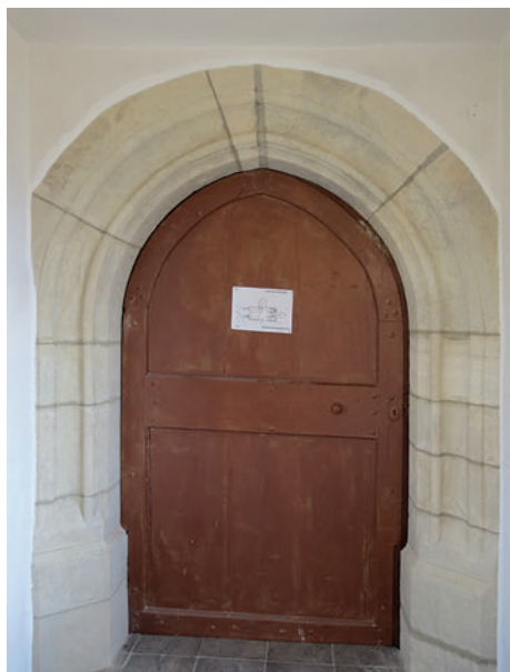
15. A nyugati bejárat