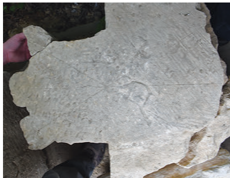
55–57. K18 – bordatöredék illetve a K3-as rétegekőhöz