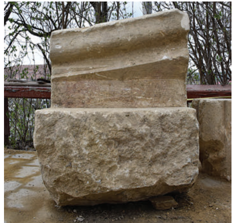
32–33. K5 – hajó boltozatának réteggőve