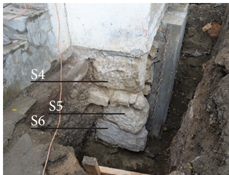
63. S4, S5, S6 – a hajó boltozatának réteggövei (?)