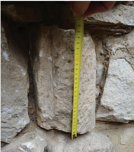
72. S11 – bordatöredék