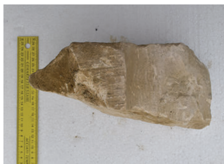
46–47. K13 – körtetagos borda kis töredéke