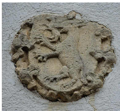
8. Boltzárókő Suky-címerrel a déli portikusz oromfalába befalazva