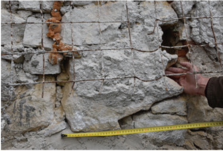
70. S13 – a hajó boltozatának indító rétegekőve