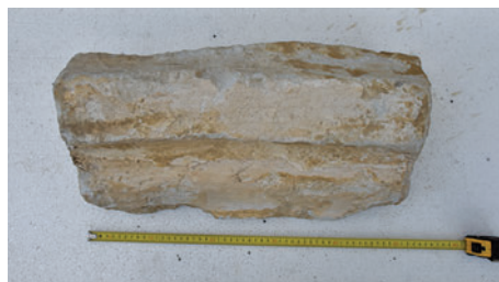
45. K12 – körtetagos borda