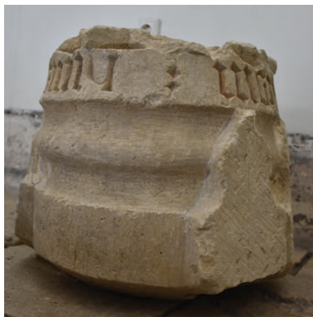
21–25. K1 – vágásos országcímeres, feliratos boltzárókő