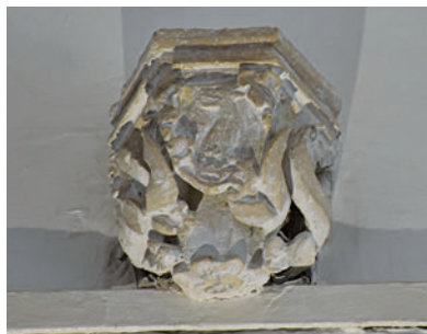
12. Suky-címeres szoborkonzol a diadalív hajó felőli oldalán