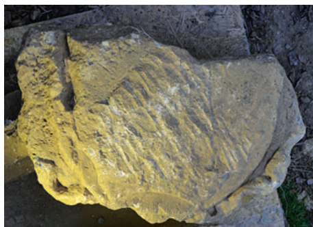
26–27. K2 – boltzárókő töredéke a Sukyak régi címerével