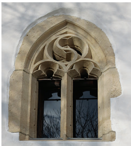
17. Gótikus ablakkeret a szentélyben