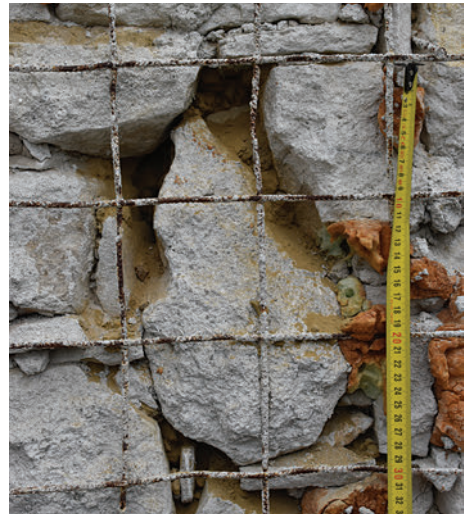
73. S14 – boltozati borda