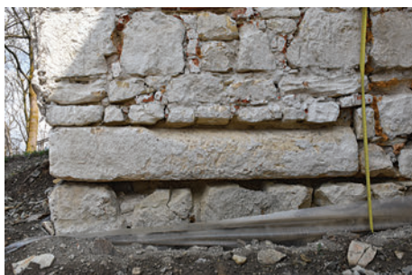
60. S2 – élszedett szárkő