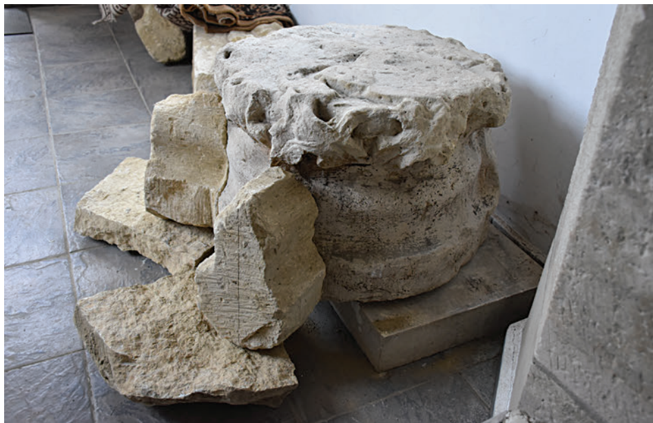
54. A K15 és K16 illesztése a pápai címeres zárókőhöz