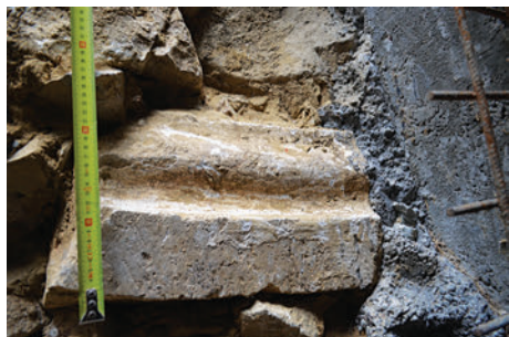
64. S8 – körtetagos borda töredéke