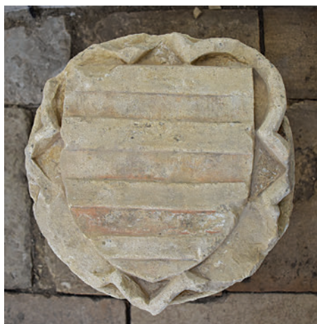
19–20. K1 – vágásos országcímeres, feliratos boltzárókő