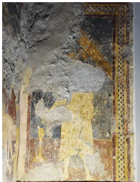
77. Krisztus-ábrázolás, falkép a hajó déli oldalán