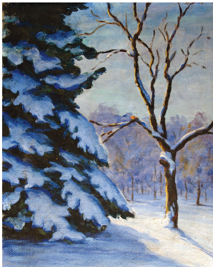
6. kép: Téli táj

téli képe az Unitárius Püspökségen található letétben. 59 A Téli táj címet viselő alkotás a téli erős fény-árnyékhatást aknázza ki, napsütötte erdőrészelete sárgás-lilás színben pompázik (6. kép). Nyilvánvaló, hogy a kevés fennmaradt alkotás alapján nem értékelhető Shakirov teljes munkássága, de nagy általánosságban elmondható, hogy az annyira szeretett nagybányai, felsőbányai, zsilvölgyi, dévai tájak megjelenítésére évszaktól függetlenül napban fürdő, élénk színeket, telített zöldeket használt, s elsősorban a festőiségre, a színhatásokra helyezte a hangsúlyt, keveset törődve a pontos rajzossággal.