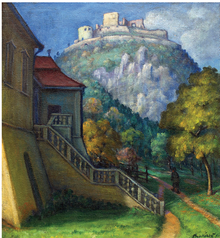
5. kép: Déva 2. (A Magna Curiával)

Mindezek közül a helyi sajtó csupán a Consummatum Est , Muzsik család , Hídépítés és Sztrájkoló k című alkotásokat, illetve egy színes, eleven vásári jelenetet emelt ki. A megrázó erejű első képen a kritikus szerint látszott, hogy a művész éveken át dolgozott rajta, a Muzsik család ot pedig „finom, hangulatos, egységesen megkomponált kép”-nek tartotta. 54 A hírlapírónak alapvetően a kedves, finom, hangulatos tájképek tetszettek a kiállításon, s az általa „szélesskálájú, invenziós és sok szociális érzékkel megáldott piktor”-nak tartott festőművészt akkor kedvelte jobban, amikor az „a természet jókedvű lírikusaként” jelentkezett.