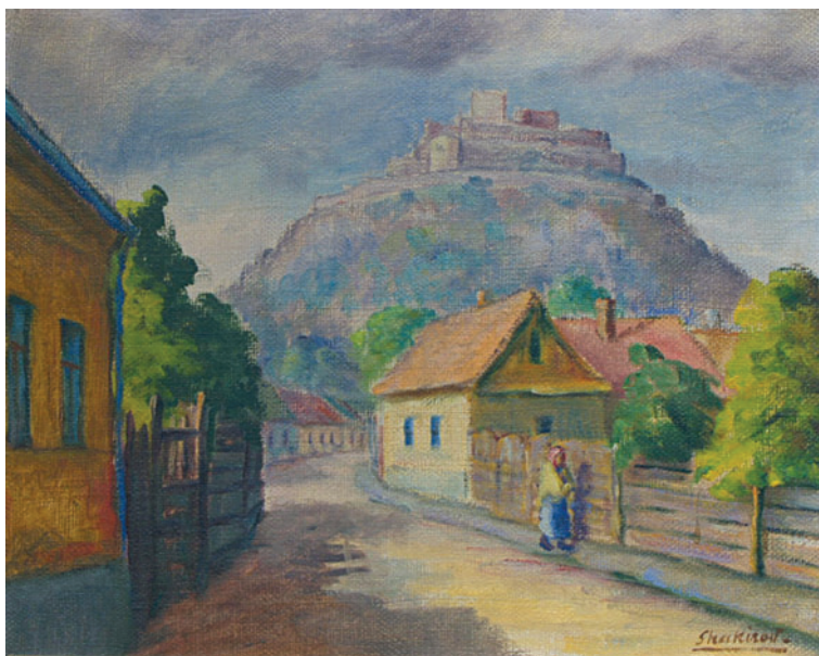
2. kép: Déva 1. (külvárosi részlettel)

is, nagyon hálás leszek érte. Nagyon megköszönöm hogy az Unitárius folyóiratokban egy-egy cikkel megemlékezik rólam. Különböztelenül Önre bízom, tudom hogy legjobb akarattal van irántam.” A négy mellékelt fénykép a Félakt , Férfi portré , Szénfejtők és Ima a tárna című festményekről készült, 47 ugyanazokról, amelyekről már 1928-ban is küldött felvételt a tanár úrnak. Az aktot és a portrét a szignó alatti évszámok alapján 1926-ban készítette. Kelemen csak részben teljesítette a festő kérését, ugyanis írt róla a Pásztortűzben , de nem az általa küldött reprodukciókat közölte, hanem az Este a bánya felé (Zsilvölgyi munkások) , Vásáros cigányok és Lókupeczek (Tanácskozó vásári cigányok Vízaknán) című festményeket. 48 Ez a hét felsorolt festmény mind szerepelt a karácsonyi tárlaton.