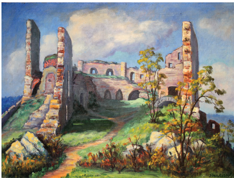
4. kép: Déva vára 2. (kettős- falszakasz)

képtárlat” katalógusa 51 35 festményt sorol fel, közöttük kiemelt helyen a Consummatum Est című, Krisztus kereszthalálát ábrázoló vásznát, amelyet 75 000 lejre becsült a művész. A második legdrágább kompozíció a Sztrájkolók volt, 35 000 lejbe került, ár tekintetében utána következtek a Muzsik család számára mellett (17 000 lej) és a Troika (15 000) című, az orosz népeletről vett jelenetek. További hét festménynek szabott 10–14 000 lej közötti árat, ezek leginkább munkásokat ábrázoló életképek ( Hídépítés , Bányászélet ) vagy táj- és városképek ( Zsidó negyed , Utca részlet ) voltak. A kiállításon szereplő Hazatérés c. festményt a Pásztortűz folyóirat hasábjain közölt reprodukcióról ismerjük: 52 az ajtón belépő, botjára támaszkodó, megfáradt, bocskorba és egyszerű paraszti ruhákba öltözött öregember feltűnően hasonlít a Shakhmurov által megfestett Orosz muzsik alakjára. 53 A többi kiállított művet többnyire 3000–8000 lejért lehetett megvásárolni, a címek alapján ezek túlnyomórészt életképek (például Kártyázók , Mosás a partokban , Pásztor tűznél , A fahordók , Vásár , Lóvásár , Korcsolyapályán ) voltak, de szerepelt a válogatásban egy-két akt, illetve egy Adakalei utca című festmény is.