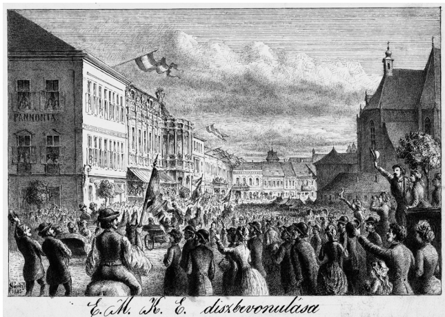
Az EMKE küldötteinek kolozsvári bevonulása 1885. augusztus 31-én