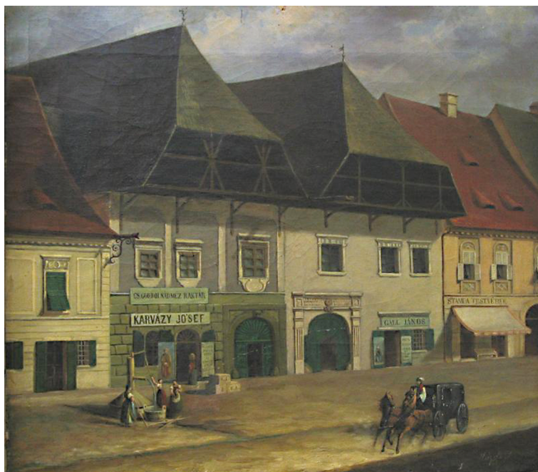
Reneszánsz házak Kolozsvár főterén. Olajfestmény az 1870-es évekből