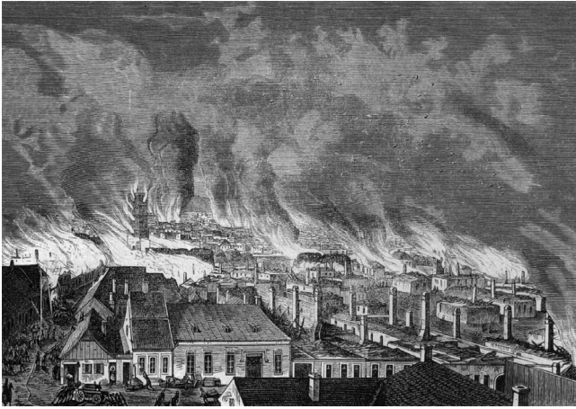
Kolozsvár égése 1876-ban. Reprodukálva Tauffer Gyula fényképén