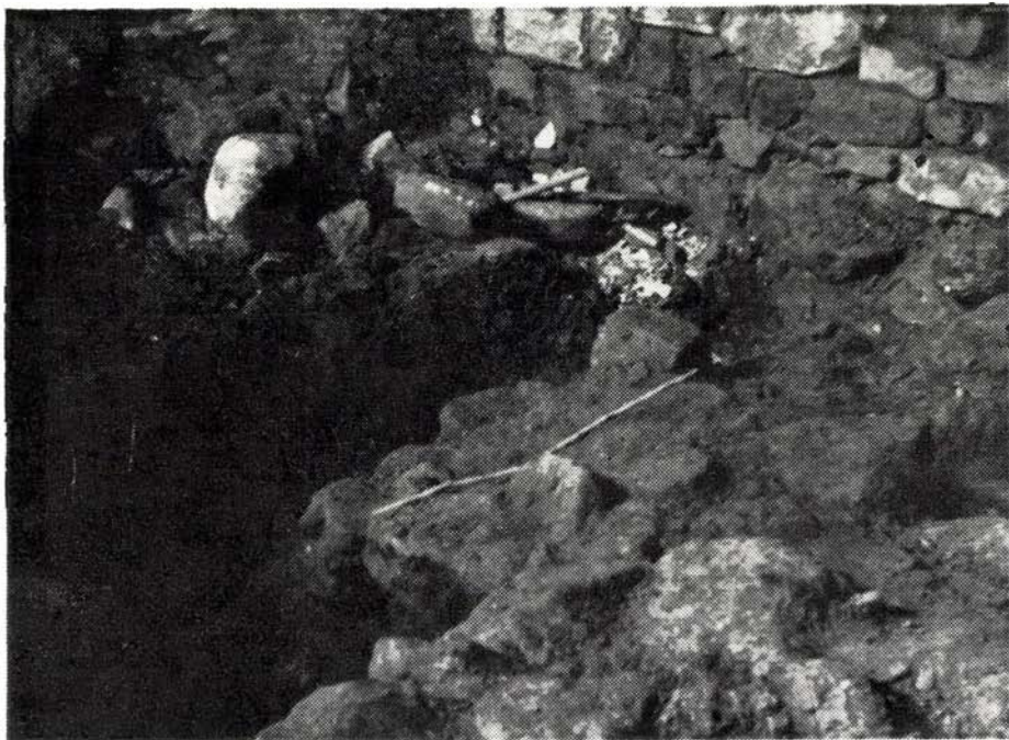
1. kép. Római kori falalap megtérése a szentély északi fala felé