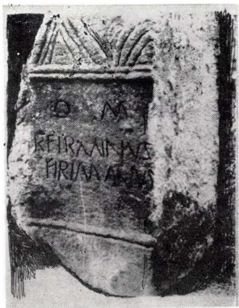
3. kép. A diadalív talpába beépített római kori feliratos kő