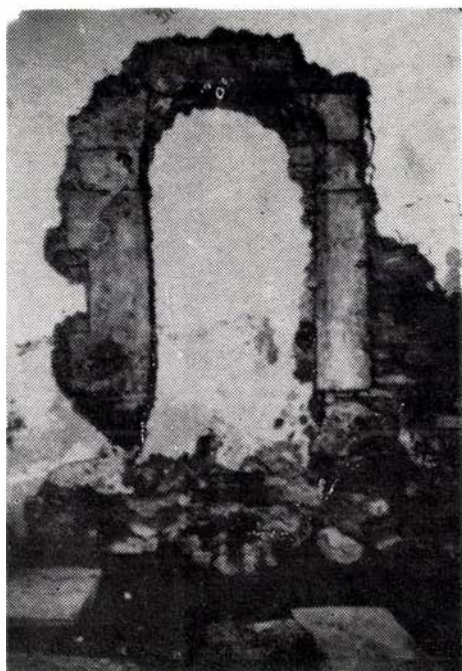
2. kép. A sekrestyeajtó kökerete a szentély É-i falában