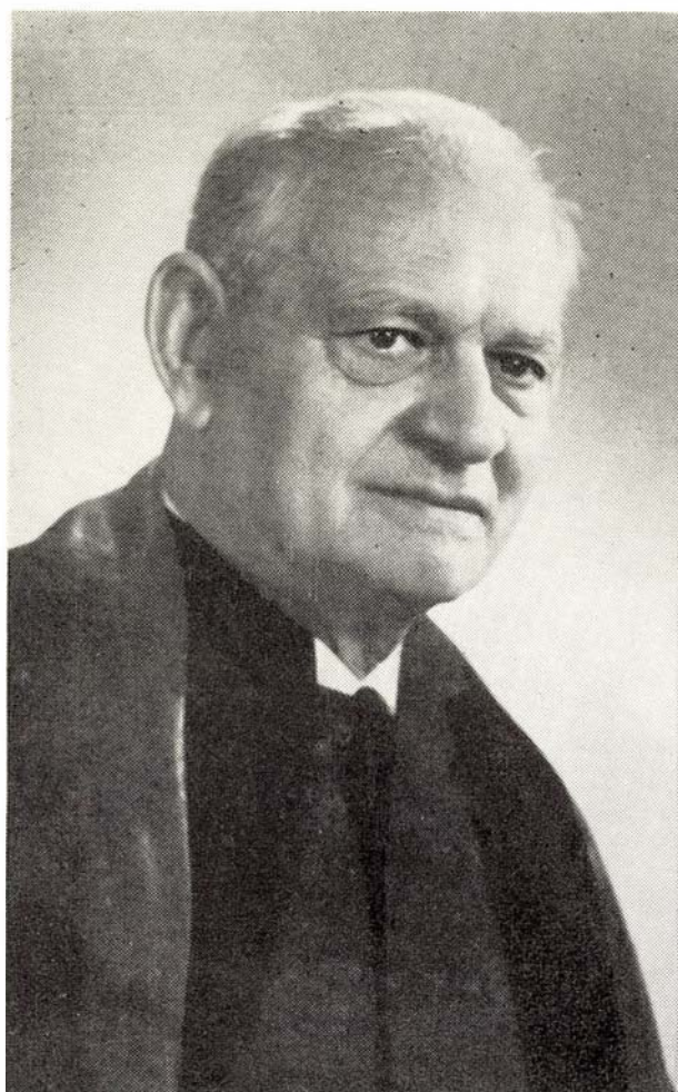
Miss Ellen minister, pres. post. K