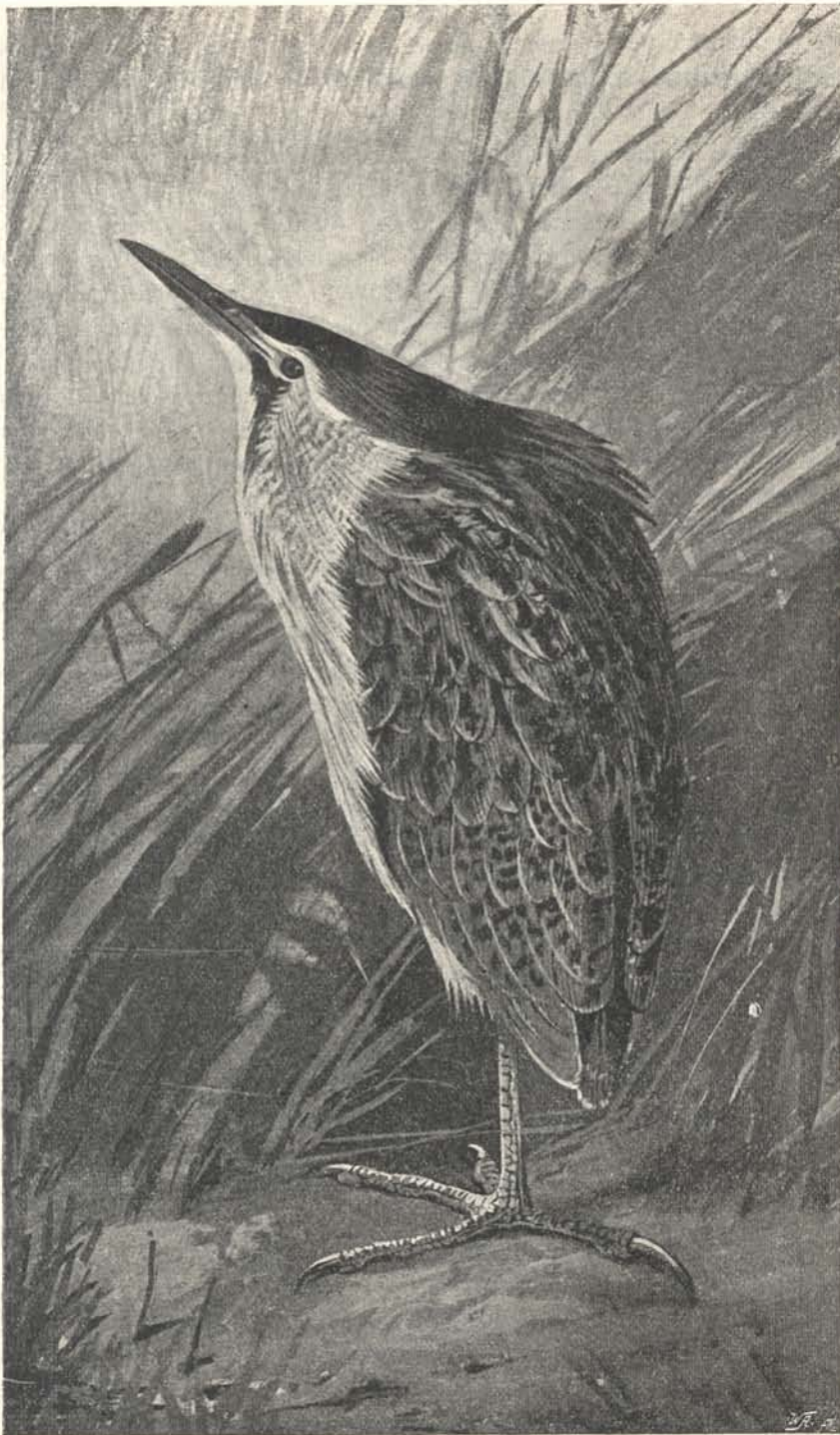
Bőömbika ( Botaurus stellaris L.). Mutatvány Chernel, Magyarország madarai II. kötetének képeiből.