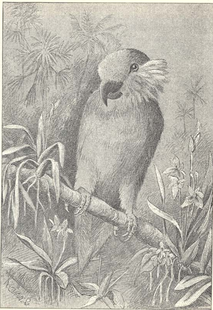
6. ábra. Cypselopterus Edwardsi Oust.

ségekben roppant nagy károgaást visznek véghez, mely mérföldekre hallatszik. A benszülöttek szép tollazatát diszül használják. Az új-guineai fekete kakadú Microglossus aterrimus hatalmas csőrével szintén említésre méltó.