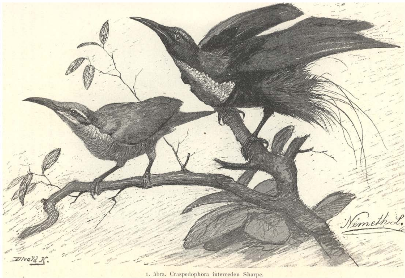
1. ábra. Craspedophora interceden Sharpe.