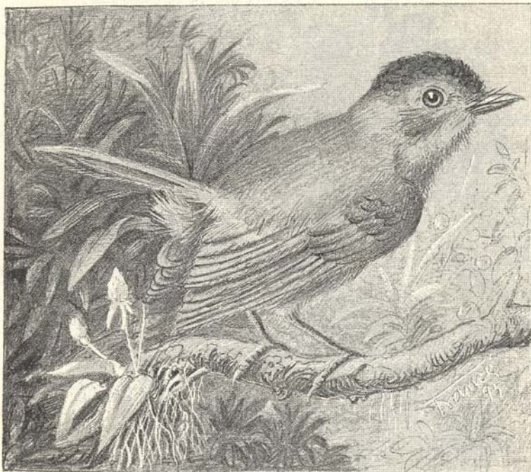
5. ábra. Arses Fenicheli Mad.

Piripio madarakat is lőtt Fenichel. A két példányban bemutatott Merops Salvadorii faj eddig még egyetlen múzeumban sem található; a típus is, melyet a drezdai múzeumban őriznek, s a mely e faj megállapítására szolgált, csak fiatal példány. Legközelebb áll a Merops philippinus -hoz, tőle azonban abban különbözik, hogy nagyobb terjedelmű és hosszabb a farka, színe pedig nem zöld, hanem aranyos olajzöld.