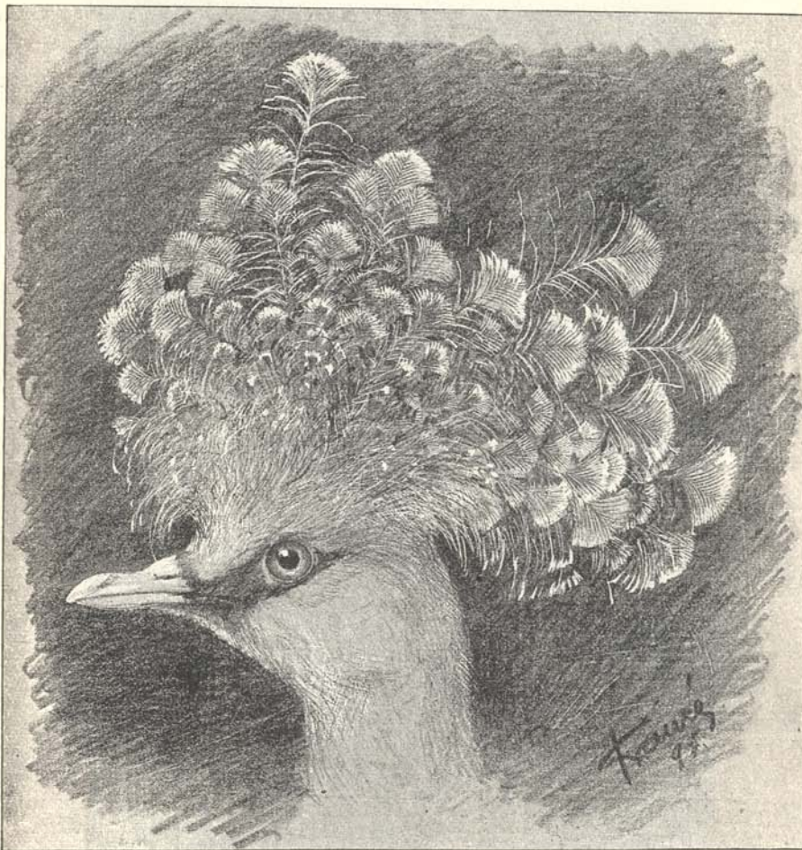
7. ábra: Goura Beccarii Salv.

A koronás galambok ( Gouridae ) közül, Fenichel az érdekes Goura Beccarii fajt három példányban gyűjtötte. E faj elejtése