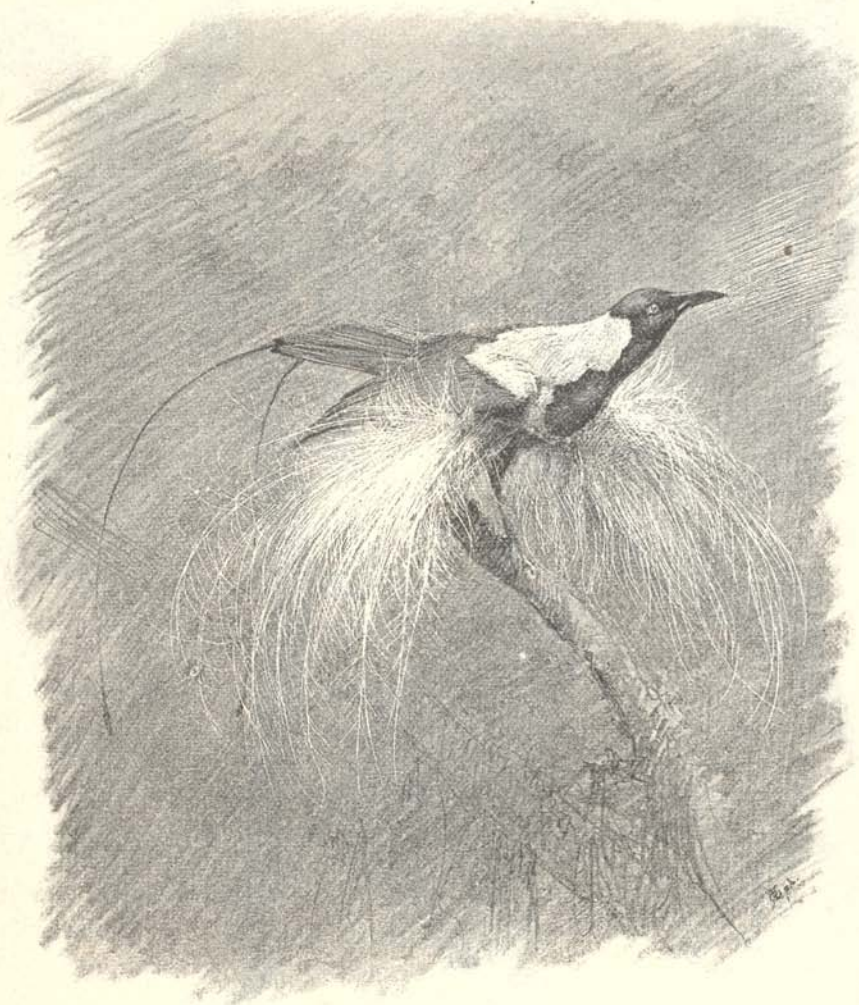
2. ábra. Trichoparadisea Guilielmi II Cab.

a két középső farktolla is hasonló; háta és szárnyfedő tollai feketék, mely szín, bizonyos szög alatt nézve, kék vagy violaszínt játszik; e tollak tapintata bársonyszerű; a madár alul sötét violaszínű és oldaltollai feketék. A jércze fölül rozsdaszínű, alul fekete hullámos keresztávokkal.