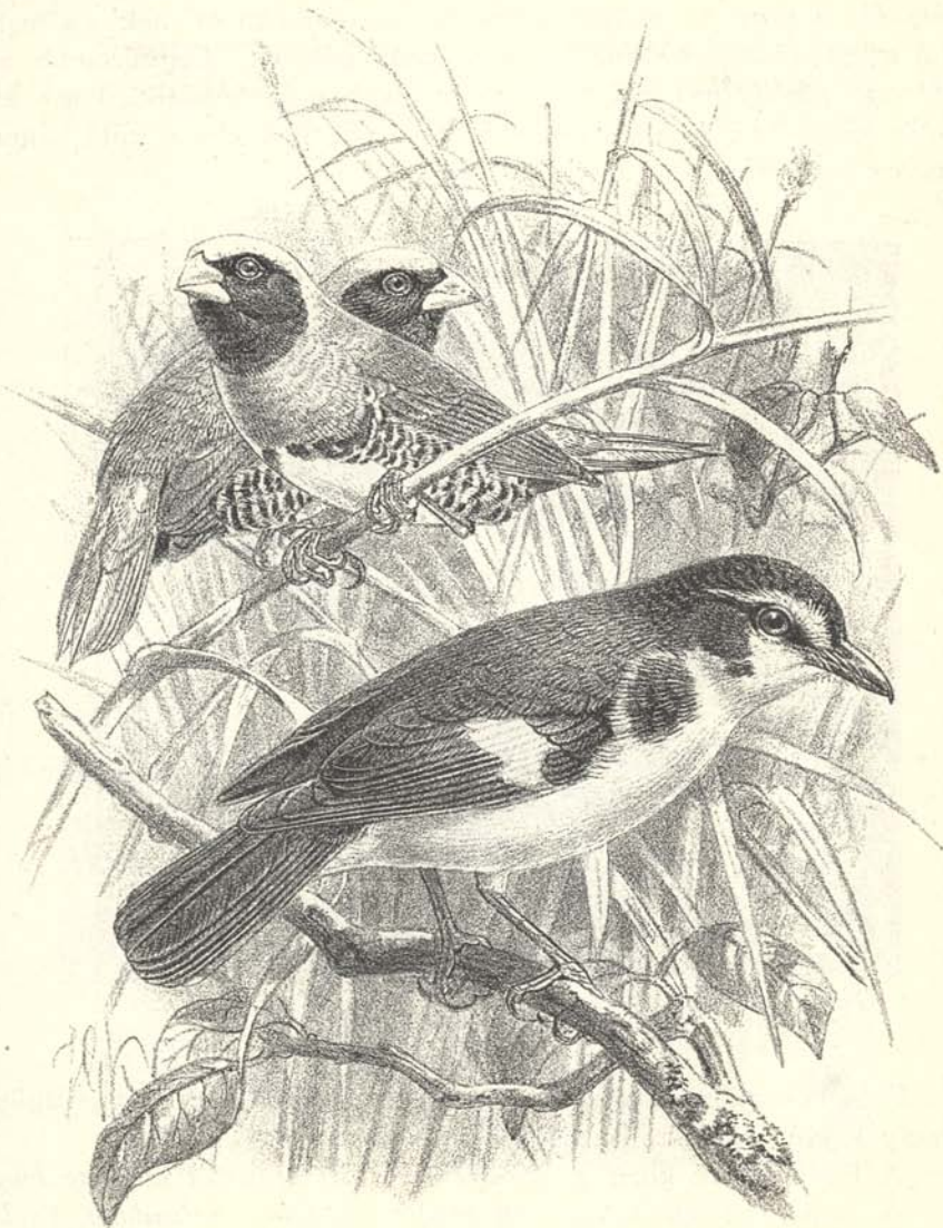
4. ábra. Donacicola Sharpii Mad. és Poecilodryas Hermani Mad.

A szövőmadarak (Ploceidae) családja egy új fajjal gazdagodott, melyet Sharpe, a British Museum madártani osztálya őrének és kedves barátomnak, tiszteletére Donacicola Sharpii -nak neveztem el.