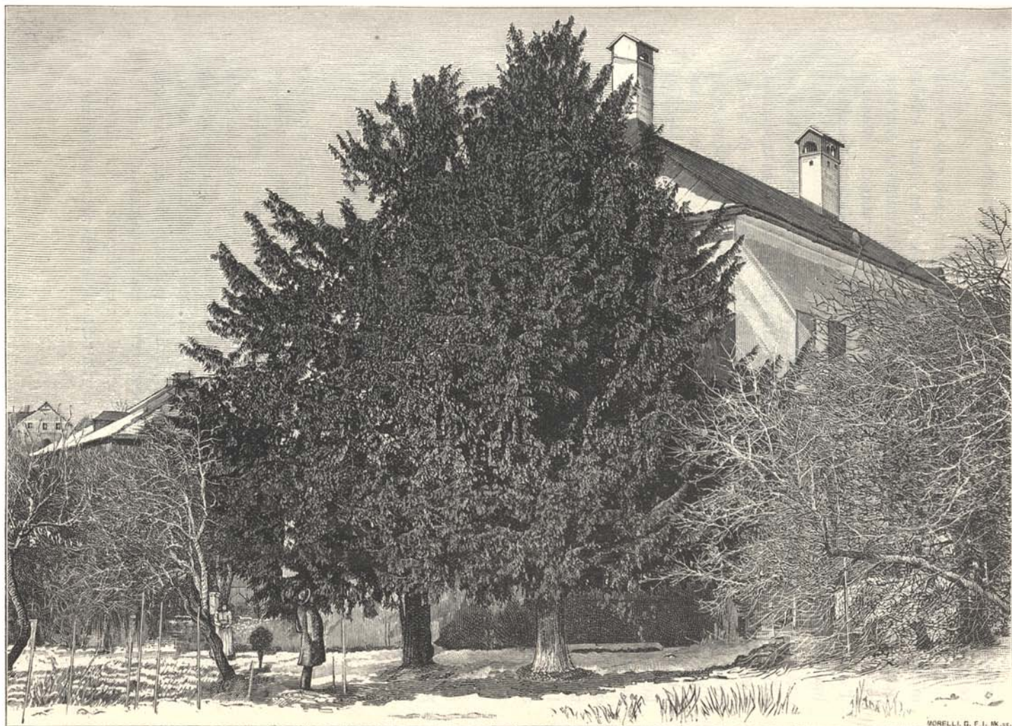
2. kép. A körmöczbányai két tiszafa.