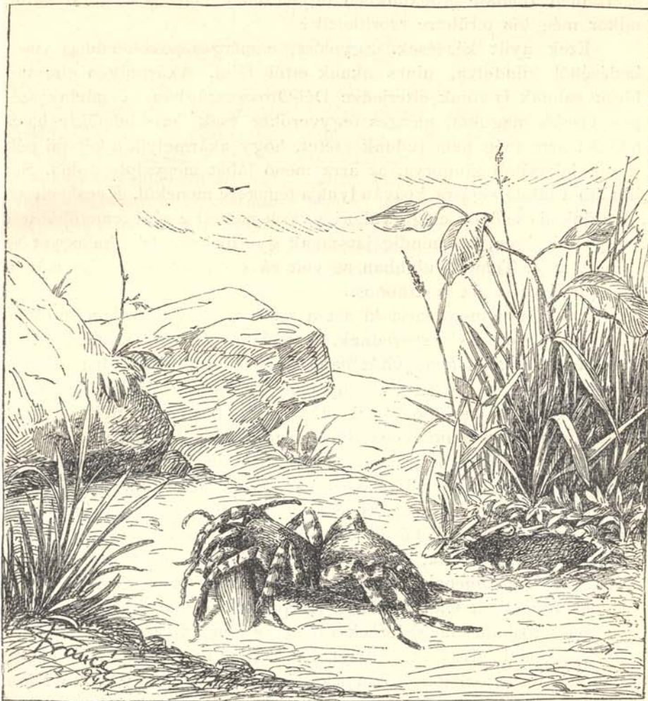
2. kép. A szongáriai cselőpók ( Trochosa singoriensis ), természetes nagyságban.

erősítik előfordulásának helyszíni körülményei is. Nagy, függőleges lyukjai, melyben a pók lakik, a hajóállomástól lefelé Kubin felé s felfelé Pancsova felé terjedő töltésen elég gyakran található, sőt Kubinnál leterjed a legelőkre is, a hol a pokoli cselőpókkal vegyesen lakik, annyira, hogy a ki ezt a két egymáshoz nagyon hasonló