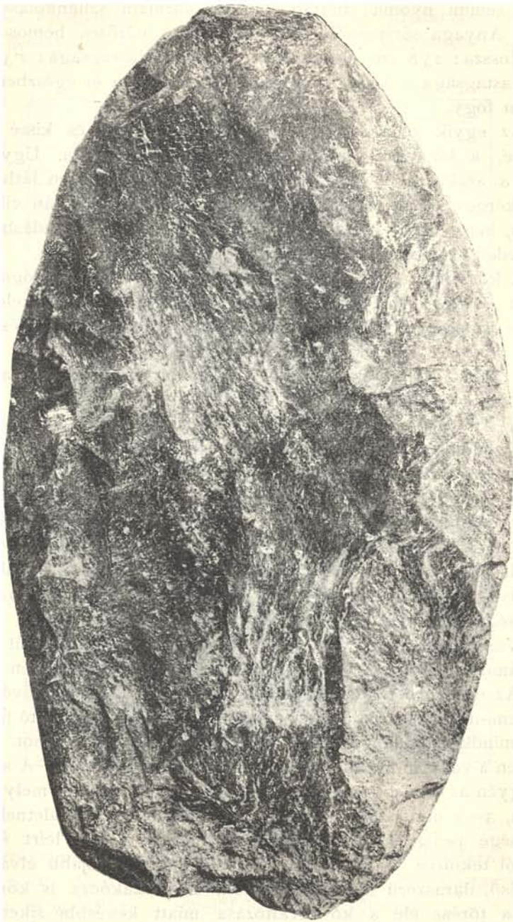
2. ábra. Tompa mandula-alakú kőszakóca. (Kicsinyítve.)