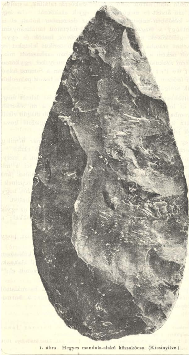
I. ábra. Hegyes mandula-alakú kőszakócza. (Kicsinyítve.)