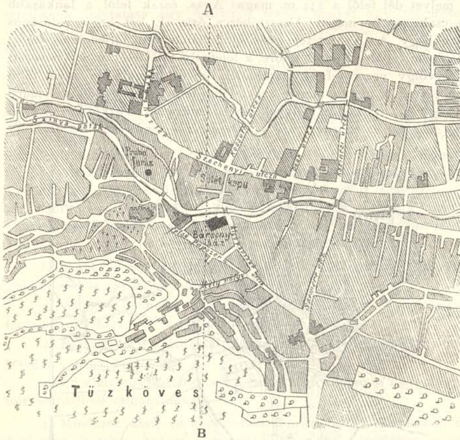
5. ábra. Miskolcz részlete a Bársony-házzal, a próbafúrás pontjával és a »Tűzköves«.

ismétlődik s a kérdés immár a pont geológiai viszonyainak tüzetesebb ismertetése, a mely azon az alapon lehetséges, a melyet Telegdi