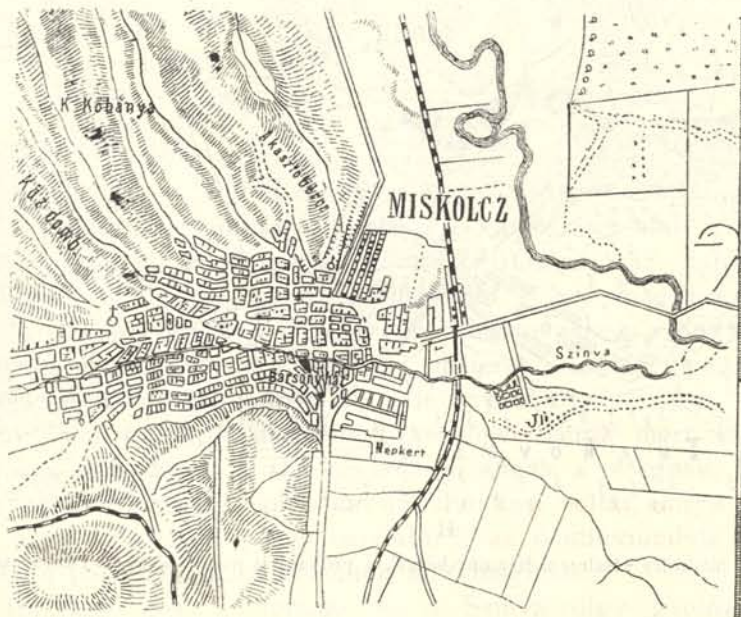
4. ábra. A-Szinva-völgy torkolata; a fekete telek a lelethely.

A mint az idecsatolt térkép-vázlat (4. ábra) tanusítja, a város a keletről nyugotra futó Szinva-völgy síkfelőli torkolatát foglalja el, a melyet dél felől a 234 m. magas Avas, észak felől a lankásabb és csak 194 m. magas Akasztóbércz őriz. E két hegy valóságos sarokhegy. Az Avas teteje erős földhullámot vető, terjedelmes »tető«, majdnem lapály. Erre a tetőre, a lelethely tája felől az úgynevezett Mélyvölgy vezet fel, egy szakadék, kevés házzal; de annál több pinczével. És úgy, a mint e szakadék a tető felé végződik, déli martján egy hát uralkodik, melynek népies határneve »Tüzköves,« még pedig állítólag azért, mert azon a helyen tüzkő fordul elő. De az, hogy