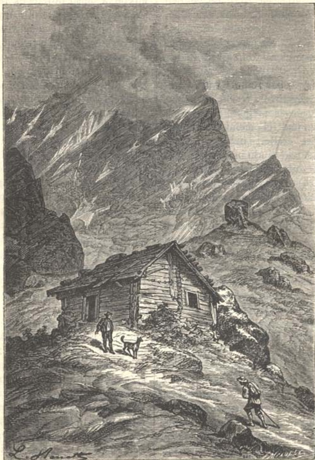
Az utolsó emberi lakás.

egymással keveredő anyagoknak. A víz, amely minden kis résen behatol a hegy belső tömegébe, másfelől meg a mélységekből gőzképen fölfelé száll, legfőbb szállítója ez egymást vonzó, taszító, s a geológiai élet örvénylő árába kerülő