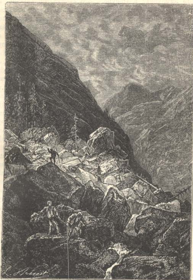
A lakosok elmennek megnézni a pusztulást.

szerepre gondolva, érti csak meg az ember a legelső költőket, a kik a Pamir vagy a Bolor tövében énekelték az első mithoszokat, a melyekből a többiek eredtek. Azt mondják ugyanis, hogy a hegységben teremtő erő rejlik. Ők öntik a