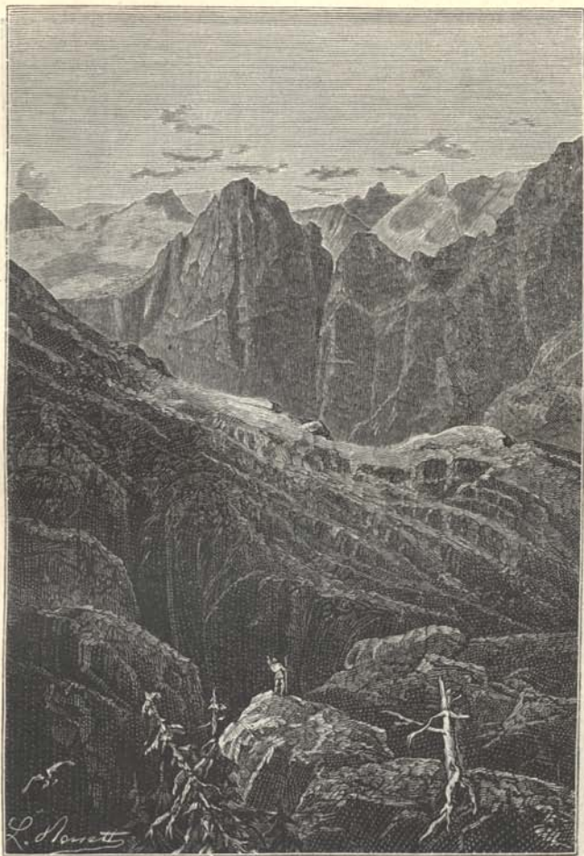
Hogy tudtak úgy felnyulni az égig?

sejében, a mik a hegy külső színét és alakját is módosítják. A szikla belsejében végbemenő mindenféle folyamat külső alakváltozással jár. A hegység kicsiben átélt valamennyi geológiai fordulalmat. Évezredekken nőtt, évezredekken