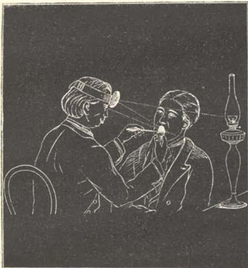
1. ábra. A gégetükörrel való vizsgálat módja.

egy magasságban van elhelyezve. A vizsgáló vagy a megvizsgálandó kendővel két ujjá közé veszi a nyelv hegyét és előre húzza, a vizsgáló a megmelegített gégetüköröt beteszi a szájüregbe, a lágy szájpadra helyezi és a vizsgálandóval E -t mondhat. A gégetükör fénylő felszínével a gége felé tekint és benne tükröződik vissza a gégefaj képe. A gégetükör a vízszintessel rendszeren 45^\circ szöget zár be; ekkor a gége kellő közepe van beállítva. Ez a szög nagyságra nézve változhatik, a mint a gége elülső vagy hátulsó részletét akarjuk inkább szemügyre venni.