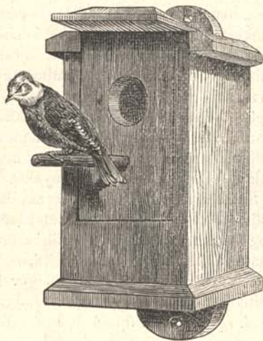
1-ső ábra. Zárt házikó czinkék számára.