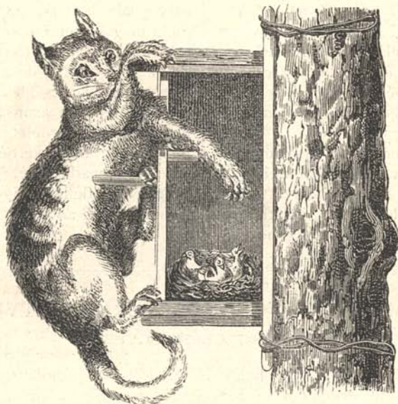
3-ik ábra. Zárt házikó átmetszetben a biztosító deszkával egy fatörzshöz erősítve.

A seregély-házikó megfelelő helyen felállítva barázda-billegető -nek és