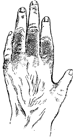
2. Vén, him simpanz keze. Gipszöntvény után. \frac{1}{4} term. nagys.