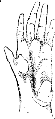
5. Cercopithecus Sabaeus keze. Viaszöntvény után. \frac{1}{2} term. nagys.