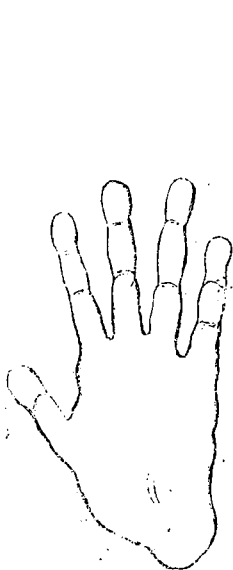
4. Maki keze. Alix után. \frac{1}{2} term. nagys.