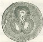
3. A bőr alatt tökéletesen felduzzadt nőstény nigua mellülről nézve. (4-szer nagytva).

helyen gyorsan tovaterjedő lobos tünemények mutatkoznak, melyeket veszélyes fekélyek, végtag-csonkulások, általános kórjelek és a legrosszabb esetekben halál is követhet.