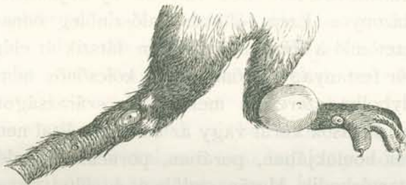
4. Mezei egér hátsó lába és farka niguákkal. (2-szer nagyítva.)

A házi állatok, és más tolakodó házi vendégek, mint, a patkány, egér, gőrény és más effélék, melyek az embert, kívánsága és akarata ellenére minden lépten s nyomon követik, folyton magokkal hordják a niguát; különösen a kutyákat és disznókat lepik meg legnagyobb mértékben; a szarvasmarhák, lovak és szamarak valószínűleg patáik és bőrük vastagságának köszönhetik