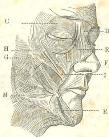
2-ik ábra. Henle után.

A. Homlok-izom (occipito-frontalis) — B. Szemöldredítő-izom (Corrugator supercilii). — C. Kör-izmok (Orbicularis palpebrarum). — D. Lobar-izom (Pyramidalis nasi). — E. Felső ajkemelő-izom (Levator labii superioris). — F. Az ajk saját emelő-izma (Levator l. proprius). — G. Közép járom-izom (Musc. zygomaticus). — H. Felső járom-izom (M. malaris). — I. Kis járom-izom (Zygom. minor). — K. Szájzug levonó-izom (Depressor anguli oris). L. Négyzetű áll-izom (Quadratus menti). — M. Nevető-izom (Risorius), egy része az úgynevezett bőnyés-izomnak (Platysma myoides).