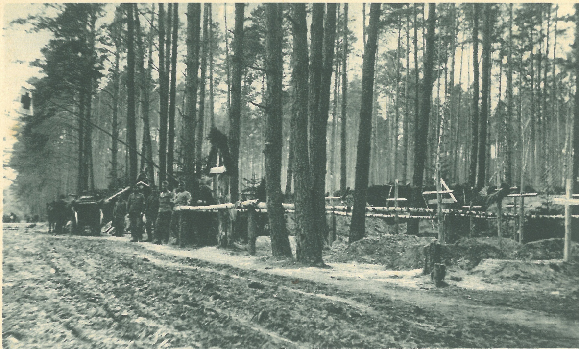
Hősök pihenője egy lengyel erdőben.