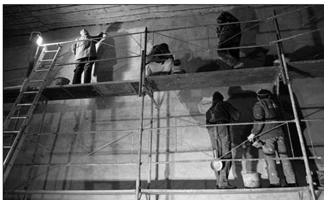
Vakolás Várfalván, 2019

Az egyházon belül az épületekről való gondoskodás szándéka erős és állandó, és az egyes közösségek erejük és ügyességük függvényében szorgoskodnak, pályázatokat írnak és helyreállítási, karbantartási munkálatokat végeznek. Az elmúlt tíz évben a 143 templommal rendelkező egyházközség közül 98-ban végeztek el valamilyen, örökségvédelmi szempontból értékelhető építészeti munkálatot, beavatkozást. Ezek nagy része több évre kiterjedő munkálat volt, de van, ahol ismétlődő vagy szakaszos tevékenységeket jellemezhetünk. Évente átlagban harminc-nyolcvan helyszínen dolgoznak, természetesen a jubileumi évben ez a szám szinte megkétszereződött. Azokat a munkálatokat számoljuk, amikről a püspökséget tájékoztatták, vagy az szakemberei által tájékozódott, és amiben szaktanácsadással részt vett, függetlenül a beavatkozások méretétől és jellegétől. Ezek között természetesen voltak kiemelt jelentőségű, átfogó munkálatok is, amelyek közül meg kell említenünk a világörökség székesyerzsi vártemplom teljes helyreállítását, amelyet a román állam támogatott, az öt Európai Unió által támogatott nagy költségvetésű projektet: a bágyonit, az oklándit, a várfalvit, a városfalvit és a később elkezdett nagyajtaikat.