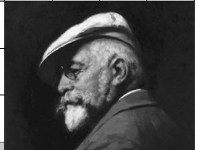
Benczúr Gyula (1844–1920) a magyar akadémikus festészet kiemelkedő alakja