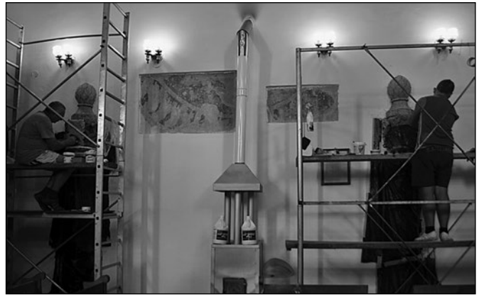
Faragottkő részletek restaurálása Magyarszovátton, 2013

A közép- vagy kora újkori védművek, várfalak bástyák helyreállítása történt meg egészében vagy részlegesen Székelyderzsen, Árkoson, Bölönben és jelenleg Nagyajtán. Egyes templomokban az épület teljes helyreállításával egybekötve vagy ettől függetlenül értékes építőművészeti tartozékokat restauráltak: Székelyderzsen, Sepsikilyénben, Oklándon, Karácsonyfalván, Nyárádszentlászlón középkori freskót, Magyarszovátton a faragottkő részleteket, a szószék-