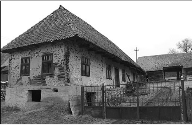
A központ épületegyüttese felújítás előtt...

mot (ma hatvanan vannak!), a visszaszerzett iskolát (ami a szentendrei skanzen unitárius iskolájának mintája lesz), a paplakot melléképületeivel, a düledező kántori lakást, és újjáépíteni, táborozásra átalakítani a használhatatlanná vált csúrt.