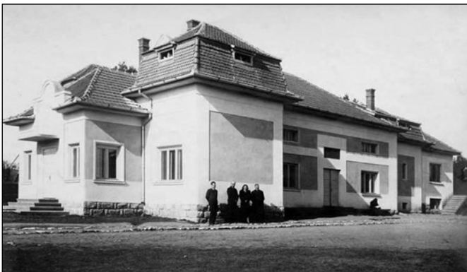
Az árkosi unitárius kultúrház 1940-ben