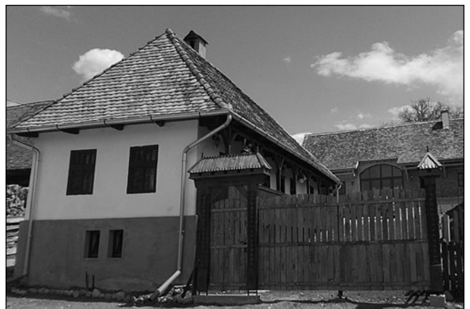
... és után

Most, amikor (nem e járványos időszakban!) alkalmanként százharminc gyermek futkos a jó falusi levegőn a házak között, s tanulja újra a székely örökséget, életet lopva a falu mélyülő csendjébe, most, amikor minden nap délben, a csűrkonyhából elindul közel száz ebéd a környék tizenkét falujába időseknek, egyedül élőknek vagy éppen keményen, jövőnkért dolgozó embereknek, hálával gondolok vissza a megtett útra. Hálát adok Istennek, aki ezt a szép feladatot adta nekünk – az építés feladatát, köszönetet mondok támogatóinknak (kiemelve Magyarország Miniszterelnökségét, a Nemzetpolitikai Államtitkárságot, a Bethlen Gábor Alapot), mestereinknek, akik segítettek abban, hogy e házak-csűrök új életre keljenek, és mindazoknak, akik ez egyre embertelenebbé váló világban Isten állandó segítségével itt, e kapun belül, mindig emberül helytállnak. Tudom és érzem, hogy a Hagyományos Székely Jövő Központ nemcsak az egykori építők iránti hűséget, hanem az általuk formába öntött alázatot, mértékletességet és bizodalmat is továbbviszi.