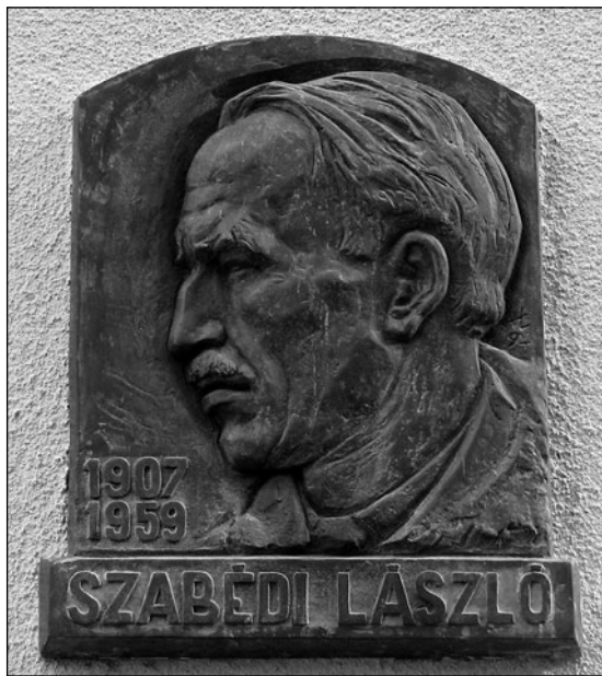
Szabéd László-plakett a szabédi unitárius templom falán

juk, hogy Szabédi ki akarta szabadítani az esztétika művelését a szovjet hegemonia alól. Más szóval: nem akarta a szovjet modellt követni csak azért, mert az szovjet, s mert a korabeli szocialista tömbben egyesek számára ez volt a divat. Ez nemcsak szakszerű, hanem bátor emberi gesztus is volt, s nemcsak az 1950-es évek kelet-európai országainak a helyzetére való tekintettel, hanem főként azért, mert a Jánosi-bírálat 1956 októberében/novemberében jelent meg, Szabédi pedig – az 1957. évi Utunk első számának tanúsága szerint – 1956. december 31-én fejezte be a választát. Vagyis azokban a hónapokban merte vállalni a szovjet sematizmus ellenében a szakmai árnyaltságot és emberi nyíltságot, amelyek az ötvenhatos magyar forradalom elfojtását követték.