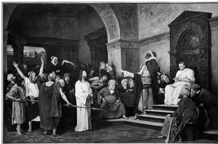
Krisztus Pilátus előtt (1881)

A fő művei között számon tartott Krisztus Pilátus előtt című munkáját 1880-ban kezdte el festeni, és egy évre rá be is mutatták Sedelmeyer műkereskedő palotájában, majd európai „turnéra” indultak a képpel. Minden városban élénk érdeklődés övezte a festményt, ezekről az esemé-