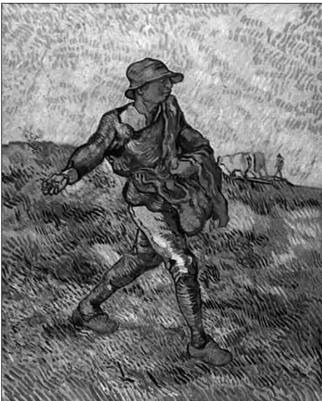
Van Gogh: A magvető (1889)

A földet „megszólítja” az eke, az ásó, a borona, a gereblye, a tárcsa, a vetőgép. A föld nem néma. Ha ter-