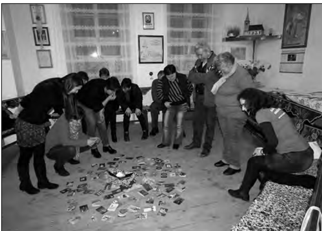
Interaktív játék pároknak Vargyason

Szeretnénk, ha a jövőben még jobban be tudnánk vonni az iskolákat a családi életre való nevelésről szóló programokkal, hogy vidékünkön a fiatalok is tuda-