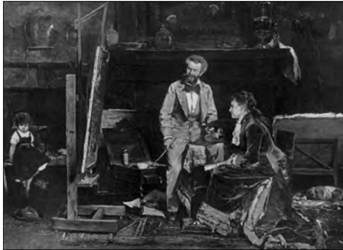
A művész és felesége a műteremben c. festményen (1876)