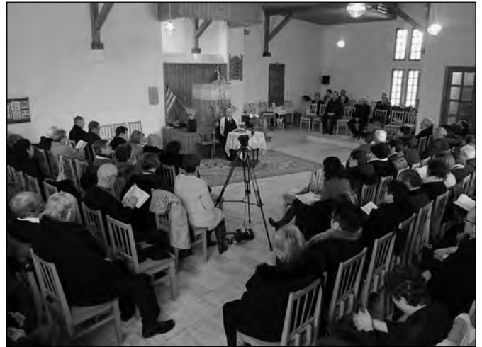
Barót, a nyitó istentisztelet

tosabban vállalhassanak majd házasságot, családalapítást és tartósan tudjanak megmaradni abban.