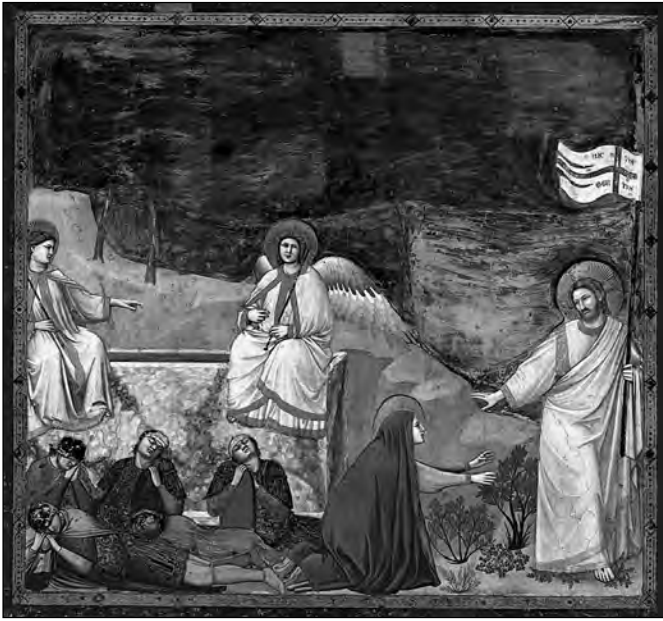
Giotto: Ne érints engem (1305 k.)

létének határait, nem tudja elfogadni, hogy nélküle működik tovább a világ törvényszerűségei szerint. A kereszténység is erre az önző felfogásra építette örökélet-hitét, de ennek a tannak nincsenek jézusi alapjai. Jézus zsidó mesterként, prófétaként nem spekulált a halál utáni élet kérdéseiről, hanem a jelenben, a mostban próbált utat mutatni. Ha Jézus örökélet-hitét kellene megragadjam, akkor leginkább a Hegyi beszéd következő mondata jut eszembe: „Aggódásával ki tud-