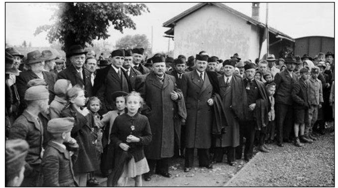
Az 1943-as vendiák-találkozó és a székelykeresztúri gimnázium 150 éves ünnepségének résztvevői