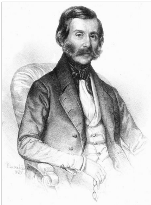
Brassai Sámuel (Barabás Miklós litográfiája, 1845)

– Brassai Sámuel – mondta Arany János –, a tudomány, elmésség s a logika fegyveres Góliátja. Amit Arany mondott, érdemes jól megjegyezni: az nem katalanra való beszéd. De nem így az apró termetű Gyulai Pál! Írhatott gyönyörű poémát ő a Székelykő mesés vasvilágáról, de Brassai előtt el-elkapta a hév: